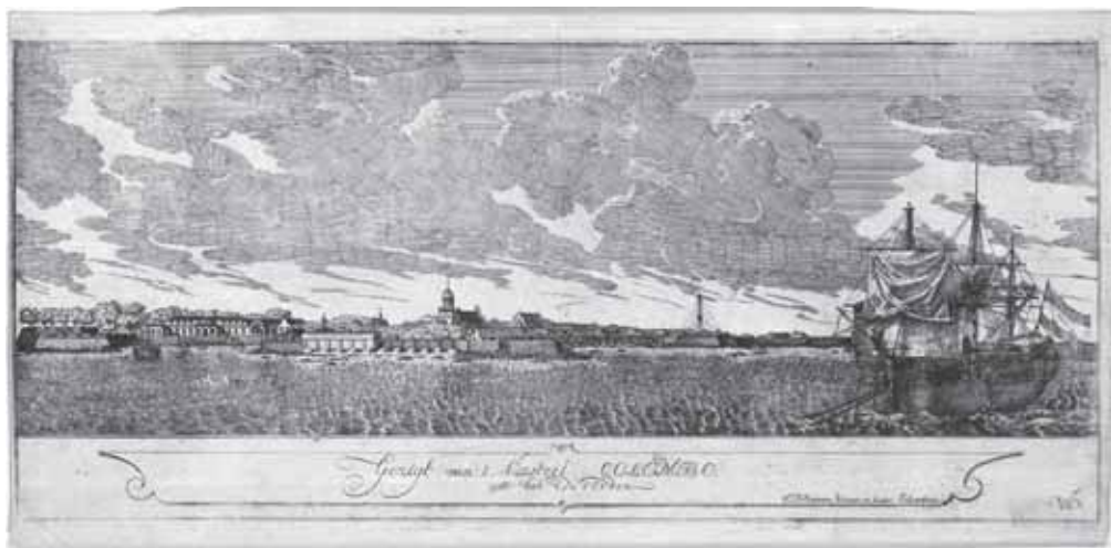
Afb. 9 Gezicht op het Kasteel van Colombo uit het Noorden. Ets, luitenant-ingenieur C.F. Reimer c. 1770 (Rijksmuseum Amsterdam).

De Raad had zich hier volledig achter gesteld, maar deze vroeg wel heel menselijk de plaatselijke bevolking te compenseren, want anders zou er een onhoudbare situatie ontstaan voor haar voedselvoorziening. 52