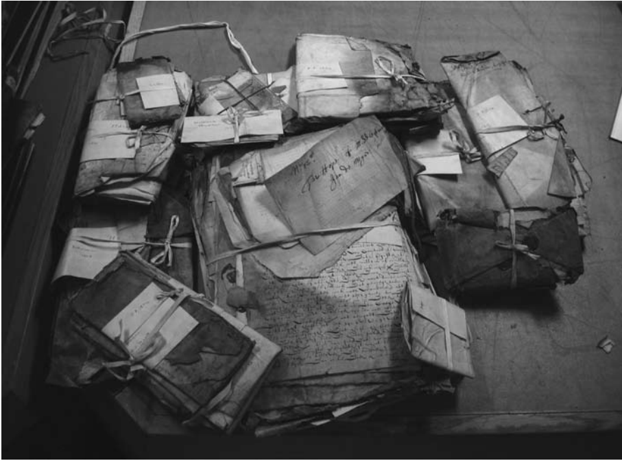
Afbeelding 1: Sailing letters in de National Archives (Kew, UK). Met dank aan dr. Roelof van Gelder en de Koninklijke Bibliotheek, Den Haag.

transcriberen ervan. Hoe moeizaam dat laatste kan zijn, weet een ieder die wel eens een historische tekst in handschrift onder ogen heeft gehad. Inderdaad, er zijn nog diverse voorbereidende fasen te doorlopen voordat het eigenlijke, interessante onderzoek in volle omvang kan beginnen, maar ter illustratie kan ik u toch al iets van dat onderzoek laten zien.