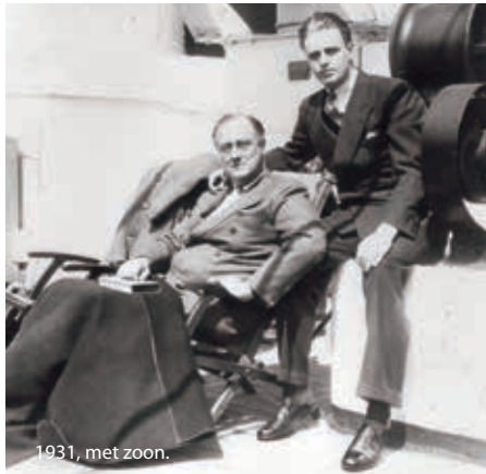
1931, met zoon.

De trailer verbindt de ‘Fear’-uitspraak met de oorlog of zijn ziekte – beide nu in de herinnering aan Roosevelt prominent. Historisch is dat niet juist, maar retorisch werkt het wel. Het ci-