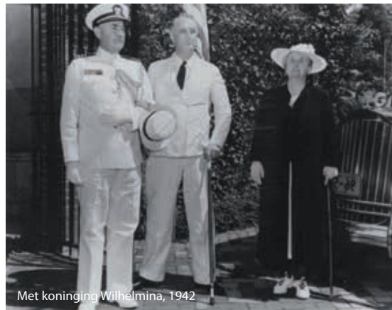
Met koningin Wilhelmina, 1942

ropa – altijd al graag gehoord. Het sluit aan bij het oude ideaal van de American Dream: het realiseren van persoonlijk succes ondanks een eenvoudige komaf en tegenslag in de jeugdijaren. Het past ook goed in laat-20ste-eeuwse opvattingen over zelfverwezenlijking en de benadering van moeilijkheden als vormende uitdagingen. Tekenend is de gang van zaken rond het Franklin D.