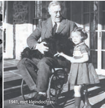
1941, met kleindochter.

verve in voor de strijd tegen polio. In dat kader richtte hij de March of Dimes op, genoemd naar de toen veel beluisterde radioshow March of Time . Deze grote en breed gesteunde stichting zamelde geld in voor onderzoek naar een poliovaccin. Het was alom bekend dat Roosevelt juist deze stichting opgericht had omdat hij die ziekte zelf overleefd had.