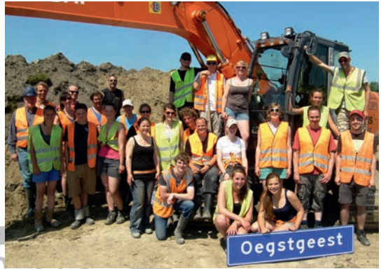
Afb. 12 Veldteam met staf en studenten van de campagne in 2013.