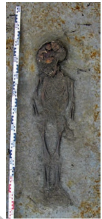
Afb. 5 Graf van een kind van ongeveer 5 jaar oud.

Tijdens de opgravingen zijn grote hoeveelheden vondsten verzameld. Het merendeel betreft dierlijk botmateriaal, waarbij vooral de relatief goede vertegenwoordiging van varkensbotten opvalt. Isotopenonderzoek, uitgevoerd op deze botten, toont aan dat een deel van de varkens geïmporteerd is. 12 Een deel van het dierlijk botmateriaal is bewerkt: vooral de fraai versierde kammen springen hierbij in het oog (afb. 11). Aardewerk is in veel