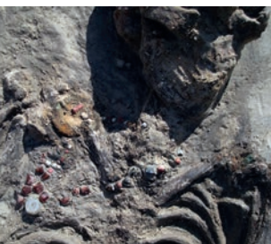
Afb. 9 Kralensnoer om de nek van het skelet van de vrouw, die tussen de 40 en 50 jaar oud is geworden.

mindere mate aangetroffen en het vormenspectrum is vrij beperkt: vooral ruw-wandige, tonvormige potten en een enkele maal kruiken en kommen. Scherven van knikwandpotten zijn zeldzaam. Wel is op enkele plaatsen redelijk wat handgevoerd aardewerk verzameld, zoals in bewoningskernen A en C. De slechte vertegenwoordiging van keramisch vaatwerk kan voor een deel verklaard worden aan de hand van het gevonden houten vaatwerk: waarschijnlijk was een aanzienlijk deel van het servies van hout. 13 Overige vondstcategorieën zijn zeldzamer. Zo komt glas weinig voor, hoewel er redelijk wat kralen zijn aangetroffen. Metaalvondsten zijn door het ontbreken van een vondstenlaag en de slechte conserveringsomstandigheden in de klei ronduit zeldzaam.