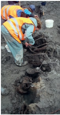
Afb. 3 Kadewerk langs de Rijngeul bij bewo- ningskern A.