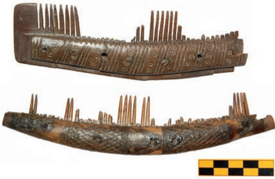
Afb. 11 Versierde kammen uit Oegstgeest (lengte schaalbalk 5 cm).