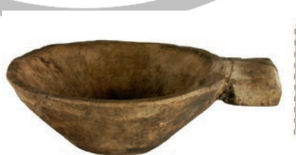
Afb. 7 Houten kommetje met handvat uit de waterput. Foto: Restauratie, Haelen; bewerking: auteur.