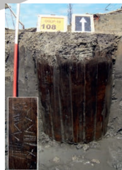
Afb. 10 Waterput met ton in bewoningskern D. Inzet: de kuitpersmerken op de ton.

Faculteit der Archeologie, Universiteit Leiden Postbus 9515, 2300 RA Leiden j.de.bruin@arch.leidenuniv.nl