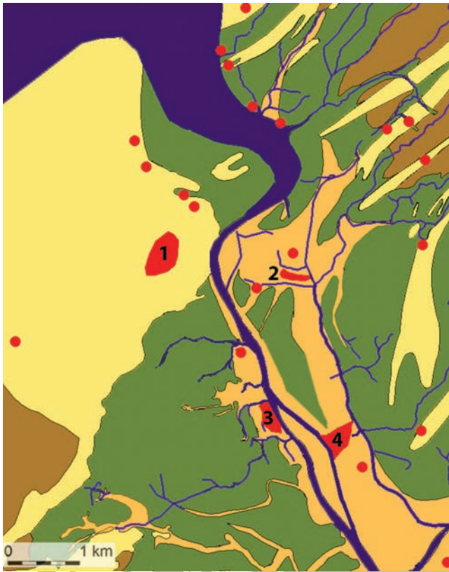
Afb. 1 Merovingische nederzettingen in een paleogeografische reconstructie van het mondingsgebied van de Oude Rijn in de Vroege Middeleeuwen. Donkerblauw is water, geel zijn de strandwallen en duingebieden, bruin de veengebieden, groen de lager gelegen kleigronden en oranje de oeverwallen langs de Rijn. De rode stippen zijn vindplaatsen van Merovingisch vondstmateriaal. Verder zijn de nederzettingsterreinen van 1. Katwijk-Zandereij, 2. Rijnsburg, 3. Valkenburg-De Woerd en 4. Oegstgeest aangegeven. Afbeelding: Dijkstra 2011, 115, Fig. 4.2. De paleogeografische ondergrond is een bewerking door Jasper de Bruin van de kaart van Van Dinter, gepubliceerd op Dans Easy (Persistent Identifier: urn:nbn:nl:ui:13-08qf-sf).

Archeologie benaderd om vanaf het voorjaar van 2009 eveneens een deel van het terrein op te graven. Dit kwam goed uit, aangezien ieder jaar in het kader van het eerstejaars veldpracticum, grote hoeveelheden Leidse studenten op een opgraving geplaatst moeten worden. Op dat moment was nog niet te voorzien dat de bemoeienis van de Faculteit der Archeologie met