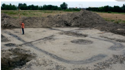
Afb. 6 Een van de omgreppelde huisplaatsen in bewoningskern B.