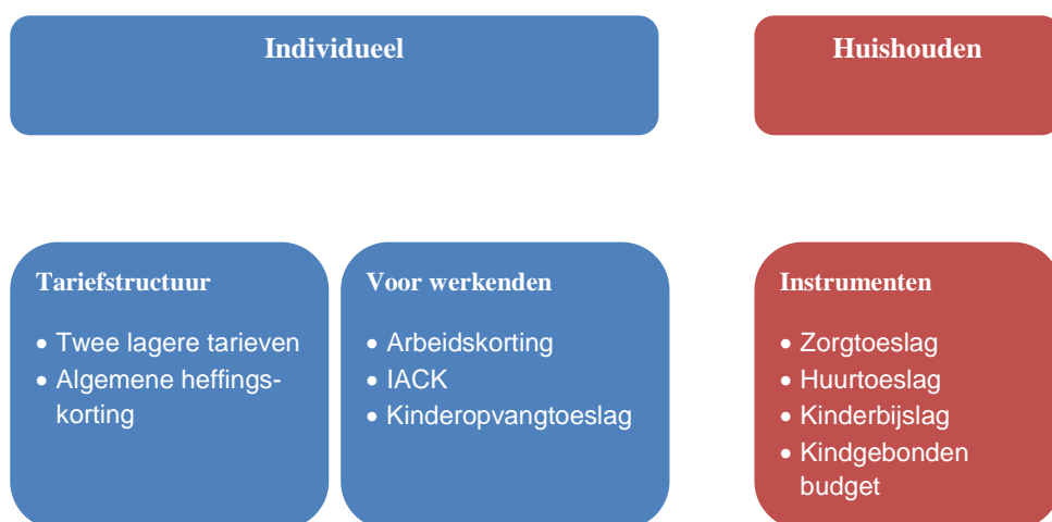
Figuur 2 Schematische weergave stelsel van inkomstenbelasting en toeslagen

arbeidsparticipatie, verdient het de voorkeur om deze niet meer te baseren op het huishoudinkomen, maar op het individuele arbeidsinkomen van de minstverdienende partner.