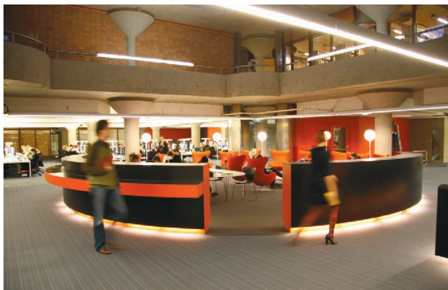
Informatiecentrum van de UB Leiden

Duidelijk komt in deze publicaties naar voren dat de inhoud van de besproken