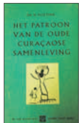
Een boekomschlag van het bekende boek van Hoetink (links) en de bundel (rechts) van Wim Klooster en Gert Oostindie.

en de vernieuwing van het trans-Atlantische Koninkrijk der Nederlanden (2012, met Inge Klinkers), Curaçao in the Age of Revolutions, 1795-1800 (2011, met Wim Klooster), De gouverneurs van de Nederlandse Antillen sinds 1815 (2011) en Postcolonial Netherlands . Sixty-five years of forgetting, commemoration, silencing (2011).