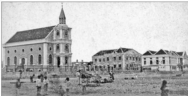
De sociale stijging van de gekleurde bevolking bleef in sociaal en religieus opzicht beperkt, omdat de protestante en joodse elite de rangen zo veel mogelijk gesloten hield. Op de foto de joodse tempel Emanu-El (Emanuel) op het Wilhelminaplein, geopend op 12 september 1867. De tempel werd gebouwd door de meer liberale joden. In de tempel zit nu het Openbaar Ministerie.

[heeft] plaatsgevonden dat geen zes families op het eiland geteld kunnen worden, welke niet aan lieden van couleur vermaagschap zijn'. Maar werd dat nu ook werkelijk geaccepteerd, binnen de blanke groep? Dat is maar zeer de vraag. Langenfeld geeft aan dat huiskleur een belangrijke determinant bleef voor het aangaan van wettige relaties. Met andere woorden, er waren wel allerlei relaties tussen mensen van verschillende kleur, maar als het aankom op een wettig huwelijk, koos maar weinig blanken een vrouw uit de Afro-Curaçaose groep. Het lijkt mij tekennend dat de voorbeelden van zulke huwelijken die Langenfeld kan geven dateren van na de Emancipatie in 1863 en juist betrekking hebben