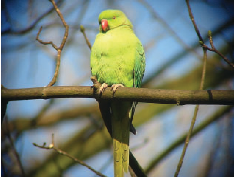
Een Halsbandparkiet rustend op een tak.