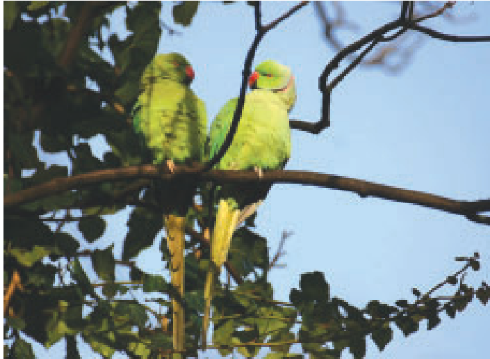
Een paartje Halsbandparkieten in het Ridderpark te Katwijk.

Er is in de literatuur gezocht naar gevallen van concurrentie tussen Nijlgans en inheemse vogelsoorten. Dit leverde een variabele lijst op van soorten waarmee de Nijlgans concurreert. Tussen 1982 en 2000 waren er 36 meldingen die betrekking hadden op achttien soorten. Daaronder waren achttien veldwaarnemingen. Tabel 1 geeft een overzicht van nestconcurrentie met onder andere roofvogels (met name Buizerd en Torenvalk) en Ooievaars en agressief gedrag tegenover soorten als de Bergeend en Zilvermeeuw. De lange lijst met soorten, aangevoerd door de Buizerd en Bergeend, hangt samen met het feit dat de Nijlgans niet kieskeurig is. De soort maakt gebruik van nesten van verschillende soorten. Als er op landelijke schaal wordt gekeken naar de trends in aantal broedparen van de concurrenten Bergeend en Buizerd, zou je een afname verwachten bij een toename van de Nijlgans. Dit is echter niet het geval. Eerdere lokale onderzoeken (Lensink & Van den Berk 1996, Van Dijk 2000, Lensink 1998b) konden ook geen negatieve invloed op inheemse soorten aantonen. Tijdens deze onderzoeken is onder andere gekeken naar trendvergelijkingen in het aantal broedparen (Lensink & Van den Berk 1996) en naar de invloed van het gebruik van roofvogelnesten door de Nijlgans op de stand van roofvogels (Van Dijk 2000). Samenvattend kan gesteld worden dat de Nijlgans in Nederland een sterke toename in aantal broedparen en verspreidingsgebied vertoont. Concurrentie met inheemse soorten