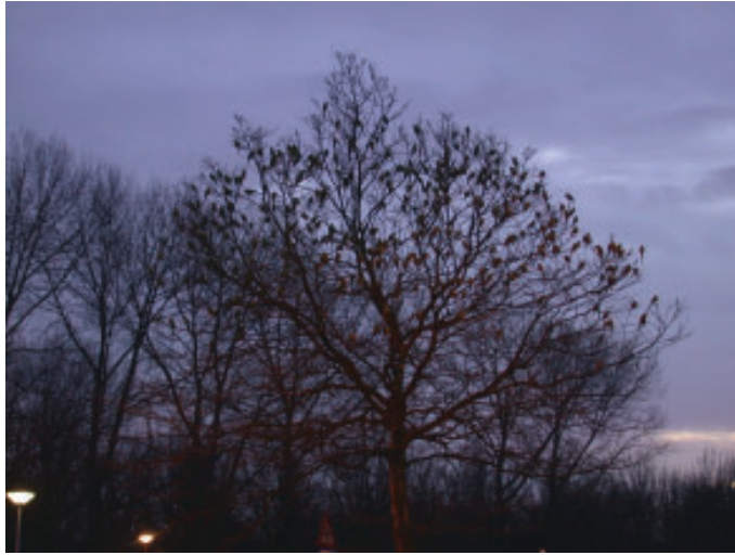
Halsbandparkieten rusten 's nachts gezamenlijk in bomen. Hier de slaappleaats langs de Prins Bernhardlaan in Voorburg op 30 december 2003, waar op dat moment ongeveer 1600 exemplaren aanwezig waren.