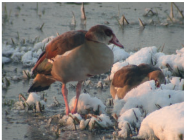
Twee Nijlganzen foeragerend in de sneeuw op de Vogelplas Starrevaart.