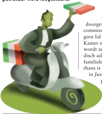
ILLUSTRATIE JOSJE VAN KOPPEN

Het beleid ten aanzien van nevenfuncties van rechters wordt verder aangescherpt. Dit blijkt uit het concept voor de Leidraad Toelaatbaarheid Nevenfuncties die onlangs aan de zittende magistratuur werd toegestuurd.