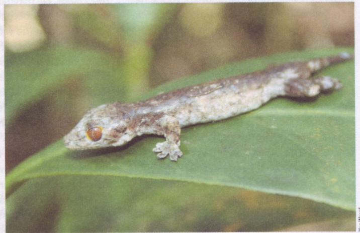
Luperosaurus kubli , een recent beschreven gekkosoort, endemisch voor de Sierra Madre