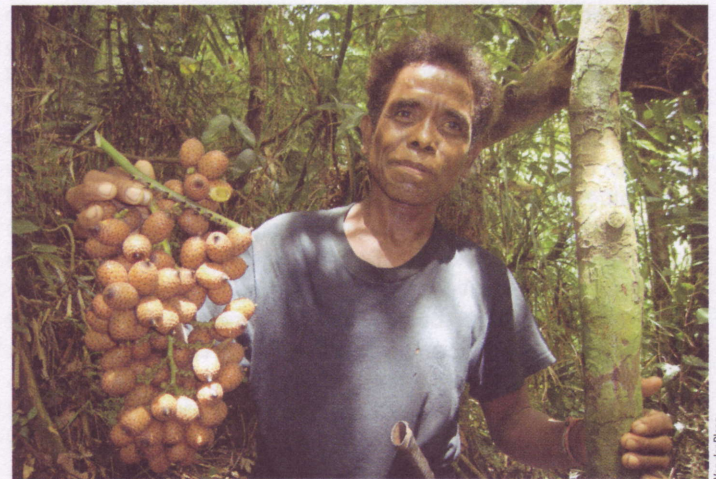
Van der Ploeg

daarvoor naar de Filippijnen komen. Sinds 1989 doet het Instituut voor Milieuwetenschappen (CML) van de Universiteit Leiden onderzoek in het Northern Sierra Madre Natural Park. Ruim honderdvijftig Nederlandse studenten verrichtten de afgelopen jaren veldwerk in het gebied. Het langlopende interdisciplinaire onderzoek naar de effecten van menselijke verstoring op tropische bossen leidde ertoe dat het Northern Sierra Madre Natural Park beschermd gebied werd. Maar ook de Universiteit Leiden trekt zich terug uit de Filippijnen. De universitaire bestuurders hebben weinig affiniteit met onderzoek op het gebied van natuurbescherming en ontwikkelingssamenwerking. De onrendabele opleidingen dierecologie, milieukunde en ontwikkelings sociologie worden wegbezuinigd in Leiden. De veldstations in de tropen gaan dicht. Ook het onlangs opgerichte Nederlands Centrum voor Biodiversiteit lijkt hier niets aan te zullen veranderen: voor natuurbescherming in de tropen is geen aandacht. Terwijl duurzaamheidsvraagstukken volop in de publieke belangstelling staan is voor het Northern Sierra Madre Natural Park geen geld meer. Als blijkt dat we geen bruikbare gegevens over het goud van Yamashita hebben, verliezen ook de militairen in Palanan hun interesse en laten ons vrij. Aan het eind van de middag vliegen we over het uitgestrekte regenwoud en vragen ons af hoeveel schatten daar beneden nog op ons liggen te wachten.