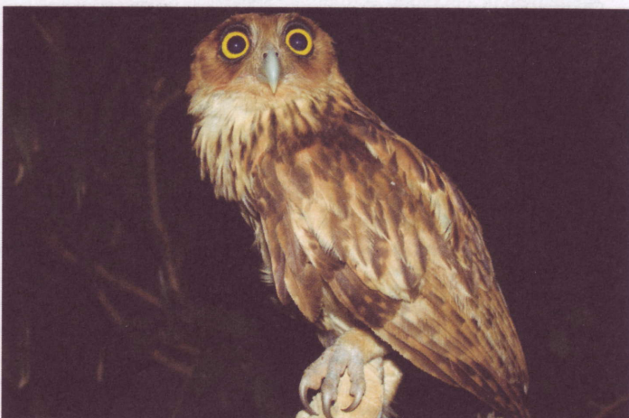
Filippijnse oehoe ( Bubo philippensis )

Terug in de bewoonde wereld. Op het vliegveld worden we gearresteerd door een militair op verdenking van schatzoeken. In de Filippijnen circuleren wilde geruchten over het goud van Yamashita. In 1945 zou het Japanse leger in de Sierra Madre een fabelachtige schat hebben verstopt. Aan de plaatselijke commandant laten we onze schatten zien. De eerste foto's van Luperosaurus kubli , een onlangs beschreven gekkosoort die slechts één keer eerder is waargenomen. 9 Twee onbeschreven libellensoorten. 10 Foto's van de zeer zeldzame Filippijnse dwergijsvogel. Een dik pak veldformulieren over het voorkomen van soorten in verschillende bostypen. En gegevens over de traditionele kennis van de Agta over de biodiversiteit in de Sierra Madre. De commandant is verbaasd over de mooie en soms wonderlijke dieren die hier voorkomen, maar bovenal over het feit dat Nederlanders