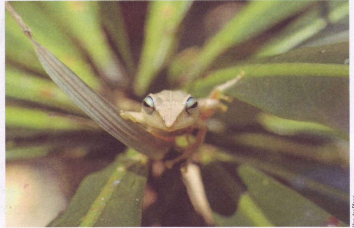
Van der Ploeg