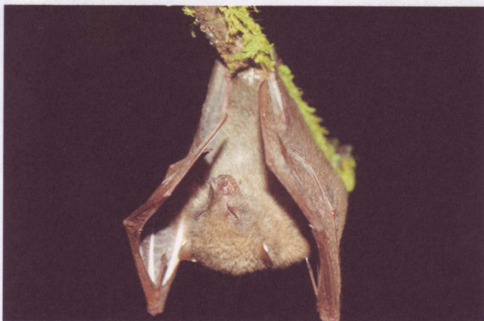
Otopterus cartilagonodus , een zeldzame fruitetende vleermuis die alleen op het eiland Luzon voorkomt in onverstoorde bergbos

We kamperen op een steile helling. Er is net genoeg water om te drinken en te koken. Na drie nachten zonder bad, voelt iedereen zich vies en moe. Het Northern Sierra Madre Natural Park herbergt verschillende biotopen: van koraalriffen en mangroven tot tropische nevelwouden en karstlandschappen. In elk gebied komen andere planten- en diersoorten voor. Één bijzonder vegetatietype komt alleen voor op extreem basische bodems met zware metalen. De houtkapbedrijven zijn hier nooit actief geweest: de kleine, verwrongen boomstammetjes zijn commercieel niet interessant. Maar sinds kort is er interesse vanuit de mijnbouw. Verschillende bedrijven proberen toestemming te krijgen om chroom en nikkel te delven in het park. Vooralsnog slaagt de parkdienst erin om de claims af te wijzen. Maar de politieke druk neemt toe. Met deze expeditie proberen we de kennis over dit bostype te vergroten. Er blijken relatief weinig vogel- en vleermuissoorten voor te komen, maar de diversiteit aan bomen is verbazingwekkend: 409 soorten in twee plots van één hectare, ruim honderd soorten meer dan op eenzelfde oppervlakte in laagland tropisch regenwoud in het park. 7 Mijnbouw in dit bostype zou een ramp zijn voor de flora. Op de vierde dag worden onze smeekbeden om water gehoord. Het gaat hard regenen. Direct is alles doorweekt en zitten we onder de modder.