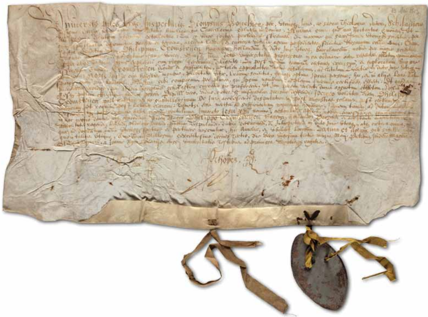
Doctorsbul van Philips van Cromstrijen (?-†1657), 23 mei 1613.