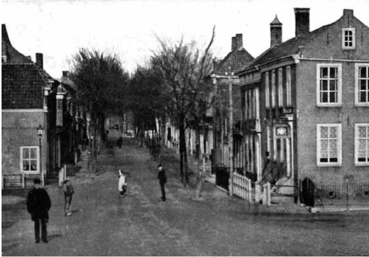
Gezicht op de Voorstraat te Numansdorp omstreeks 1900. Vooraan rechts Het Wapen van Cromstrijen, de vroegere herberg De Drie Pluimen.

De combinatie van het bodeambt met een baantje als herbergier, zoals we die zien in Cromstrijen, was niet alleen handig maar ook zeer gebruikelijk. In veel plaatsen was het zelfs de schout die optrad als uitbater van de plaatselijke kroeg. 9 Een enkele baan leverde te weinig inkomsten op, vandaar dat men de toevlucht zocht tot dergelijke combinaties. Toch kleefden er nogal wat nadelen aan het aanstellen van herbergiers in bestuurlijke ambten. In een herberg kwamen voortdurend vreemdelingen over de vloer. Een loslippige herbergier zou zo de hele stad in gevaar kunnen brengen, aldus het stadsbestuur van Breda omstreeks 1600. 10 Maar dat was niet het enige probleem. De bestuurders van Sint-Annaland struikelden soms over de dronkelappen wanneer zij de vergaderkamer probeerden te bereiken. En dan kwam het ook nog wel eens voor dat reizigers of anderen gebruik maakten van deze ruimte. Zaken die de magistraten op geen andere wijze konden interpreteren dan als 'kleynaghting van soo een aansienlijk dorp'. 11