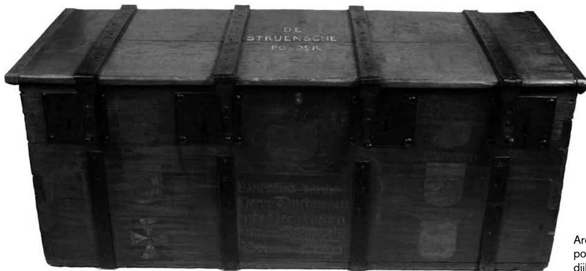
Archiefkist van de Strijense polder met de wapens van de dijkgraven en heemraden, 1651.

Van der Lith kan zeker niet worden aangemerkt als de meest competente bestuurder. Hij zal nog vaker in negatieve zin opduiken. Toch is het niet juist hem aan te wijzen als de enige schuldige. Schaarse gegevens wijzen erop dat de belastingmoraal in de polder nogal te wensen overliet, iets waar Cromstrijen overigens niet alleen in stond. In 1672 had Van der Lith over de jaren 1656 tot en met 1670 maar liefst 21.624 gulden, 5 stuivers en 6 penningen tegoed. 183 Niet alleen van de bevolking maar ook van enkele ambachtsheren. Door het grote aantal heren, konden zij zich gemakkelijk onttrekken aan hun belastingverplichtingen. De Staten van Holland brachten dat in 1674 zeer scherp onder woorden: