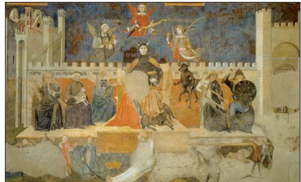
Figuur 3, Siena, Palazzo Comunale, Sala dei Nove. Ambrogio Lorenzetti, Allegorie van het Slechte Bestuur (1339).

Voor wie enigszins vertrouwd is met de geschiedenis van de Noord- en Midden-Italiaanse stadstaten zal onmiddellijk