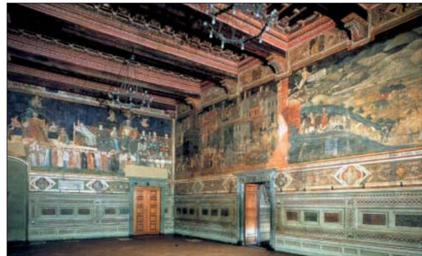
Figuur 1, Siena, Palazzo Comunale, Sala dei Nove. Ambrogio Lorenzetti, Allegorie van het Goede Bestuur (links) en zijn weldadige effecten (rechts)(1339).