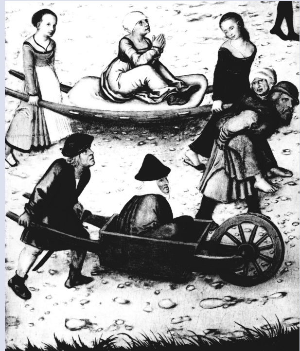
Detail van het schilderij Der Jungbrunnen van Lucas Cranach de Jongere. Op allerlei manieren worden oude dames naar het verjongende water vervoerd.

De titel van dit afscheidscollege heeft wellicht bij u de verwachting gewekt dat u een spannend verhaal tegemoet mocht zien, gelardeerd met elementen als een raadselachtig schilderij, occulte praktijken, geheime genootschappen en