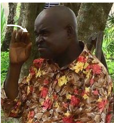
Figure 5.4: COUCHER-DU-SOLEIL