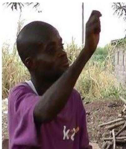
Figure 5.3: PEINDRE (pour exprimer 'couleur')