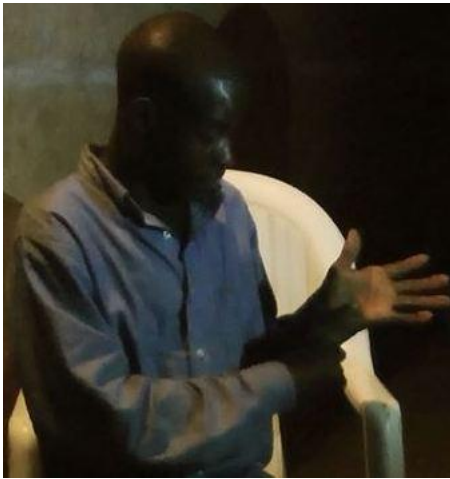
Figure 5.6: FROTTEMENT-paume pour exprimer 'blanc'

Deux instances faisant ressortir le frottement de la paume de la main ont été identifiés (figure 5.6). Dans le premier, il s'agit d'un état (gentillesse) et dans le second, d'un type de comprimé pour les soins. Dans chacun des cas, le signe réfère à 'blanc'.