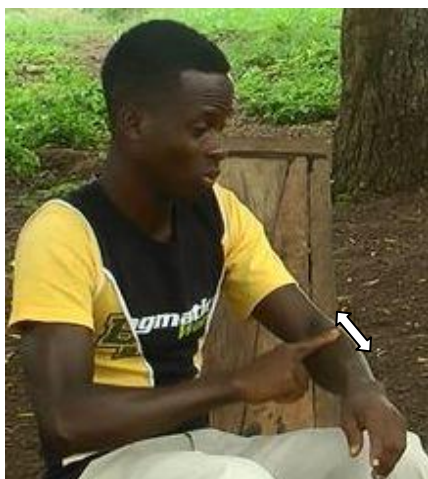
Figure 5.2: FROTTEMENT-bras