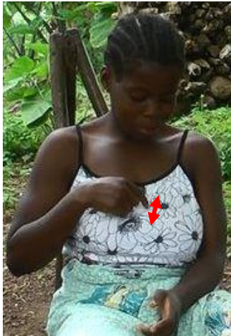
Figure 5.1: FROTTEMENT-vêtement pour exprimer ‘blanc’

haut, COUCHER-DU-SOLEIL qui exprime ‘noir’ (figure 5.4) avec un petit mouvement de la main indiquant la position relative du soleil au coucher. LEVER-DU-SOLEIL, qui désigne ‘blanc’ (figure 5.5) est réalisé avec les deux mains, paumes ouvertes qui partent du centre vers les extrémités.