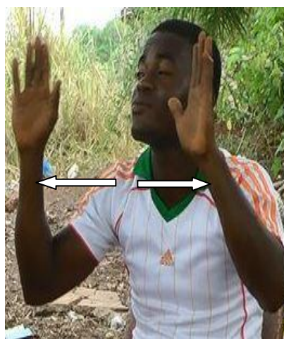
Figure 5.5: LEVER-DU-SOLEIL