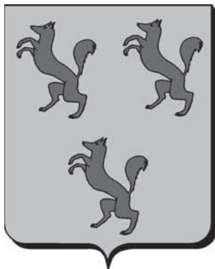
Afb. 1 Het wapen van de familie Van der Heim: drie klimmende rode vossen op een goud veld (Centraal Bureau voor de Genealogie, Den Haag).

emigreerde. Wij zien in de loop van de zeventiende eeuw leden van de familie Van der Heim opduiken in de steden Delft, Schiedam en Rotterdam. Schiedam lijkt als eerste plaats van vestiging af te vallen, omdat van de derde zoon van Rutger, Hendrik (?-1667), wordt vermeld dat hij de eerste was die daar neerstreek. 7 De poorterboeken van Delft en Rotterdam helpen ons niet veel verder. Die van Rotterdam beginnen in 1699 en de boeken van Delft vertonen een lacune tussen 1621 en 1657. En juist deze periode is mijns inziens van belang aangezien de Van der Heims in de jaren veertig hier al belangrijke posities bekleedden en met leden van het patriciaat huwden. 8