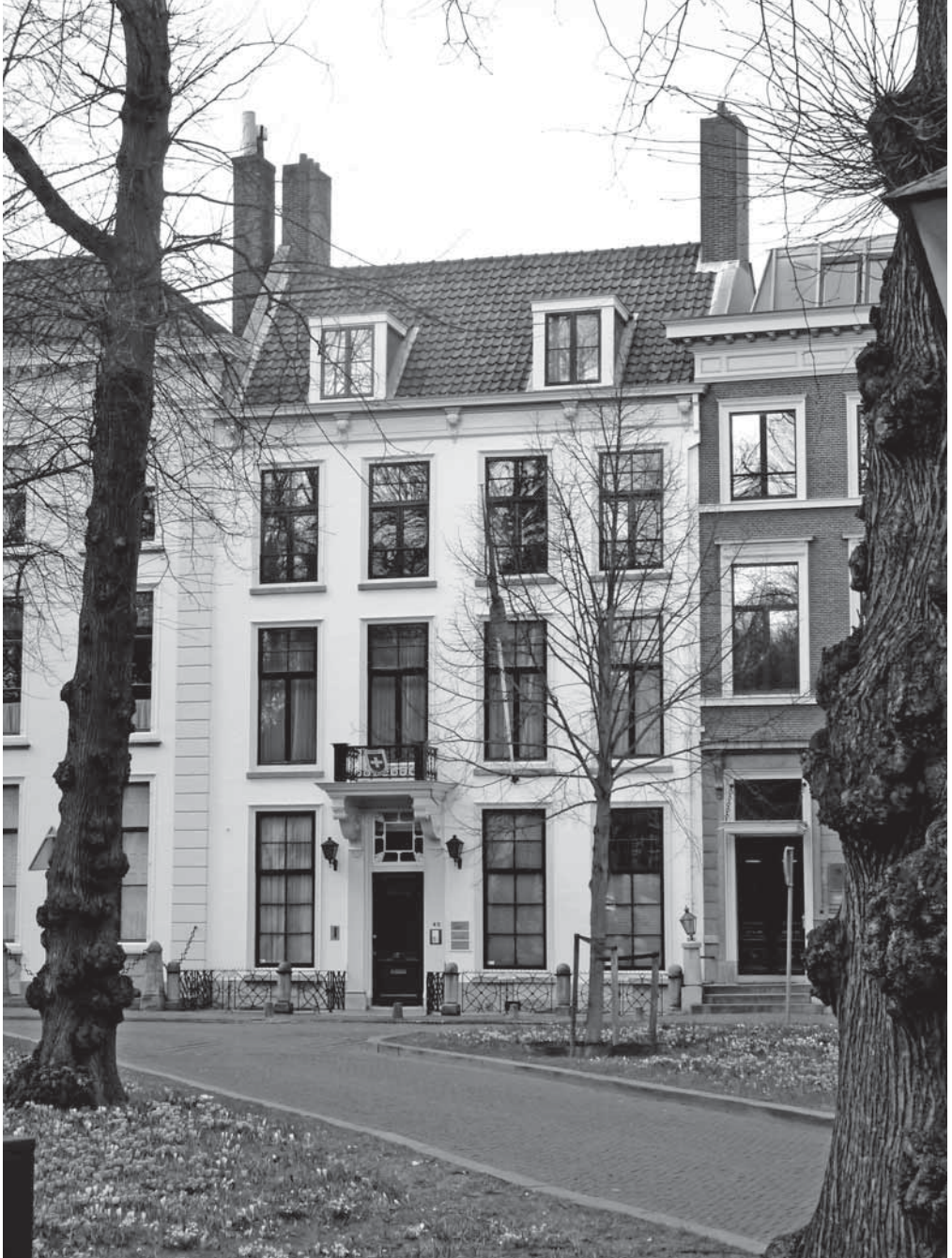
Afb. 3 Op de plek waar nu het negentiende eeuwse gebouw staat waar de Zwitserse ambassade in gehuisvest is, heeft het geboortehuis van Anthonie van der Heim gestaan (foto J.M. Dral-Pieters, 2016).