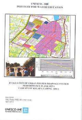
Bijzondere polderboeken uit bibliotheek UNESCO-IHE

pelijke Bibliotheken, die geheerd is aan de NVB. In deze werkgroep hebben zich bibliotheken verzameld die bijzondere collecties in huis hebben. 2 De zes bibliotheken van dit project waren: de bibliotheek van het Rijksmuseum Amsterdam, Aletta en het Zuid-Afrikahuis in Amsterdam, UNESCO-IHE in Delft, Institute of Social Studies in Den Haag en het Geldmuseum in Utrecht. Projectleider was Jos Damen van het Afrika-Studiecentrum in Leiden. Belangrijkste doelstelling van de bibliotheken was het vergroten van de zichtbaarheid van de collecties voor hun (potentiële) klanten en daarmee van het gebruik