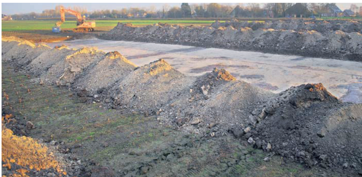
De kraan en onderzoekers hebben het meeste veldwerk in Hoogkarspel uitgevoerd. Op de achtergrond de Streekweg.

Ente, P.J., Een bodemkartering van het tuinbouwcentrum "De Streek". (Verslagen van Landbouwkundige Onderzoekingen, 68.16), 1963, Wageningen.