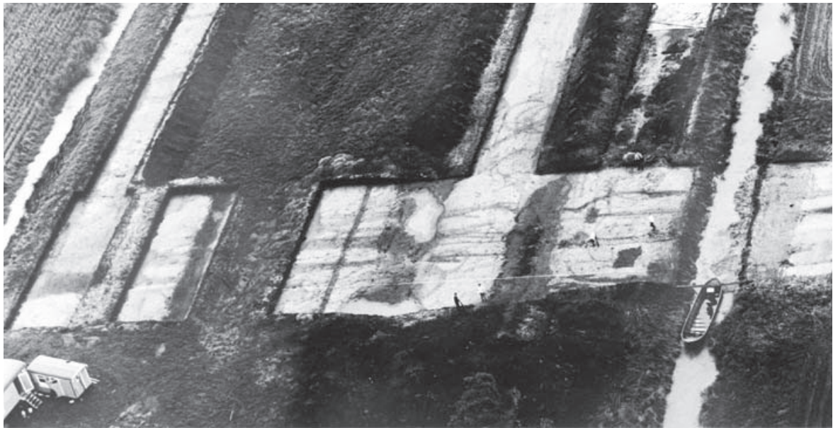
Luchtfoto van het onderzoek Hoogkarspel-Tolhuis uit de jaren zestig van de vorige eeuw.