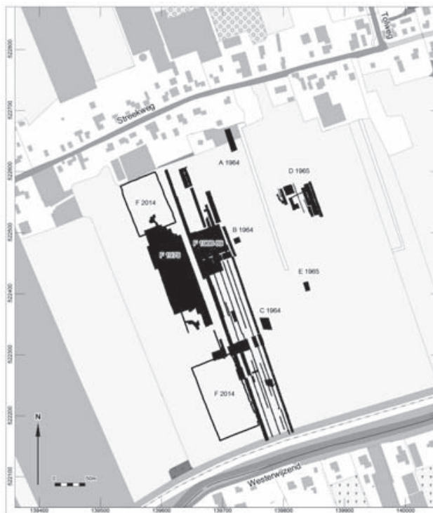
Kaart 1. Ten zuiden van de Streekweg in Hoogkarspel zijn in de loop van de jaren vele opgravingen uitgevoerd. (kaart auteur)

In het kader van de verbreding en omlegging van de N23 (Westfrijsiaweg) zijn vanaf november 2014 enkele grootschalige archeologische onderzoeken gestart, vooral rond Hoogkarspel. Het tracé is vlak langs en door de oude opgravingsputten ten zuiden van de Streekweg gepland. Voor archeologen een goede gelegenheid om voorafgaand aan de bouwwerkzaamheden ter plaatse onderzoek te verrichten. In november en december 2014 zijn twee grote terreinen tussen de Streekweg en de Westerwijzend opgegraven.