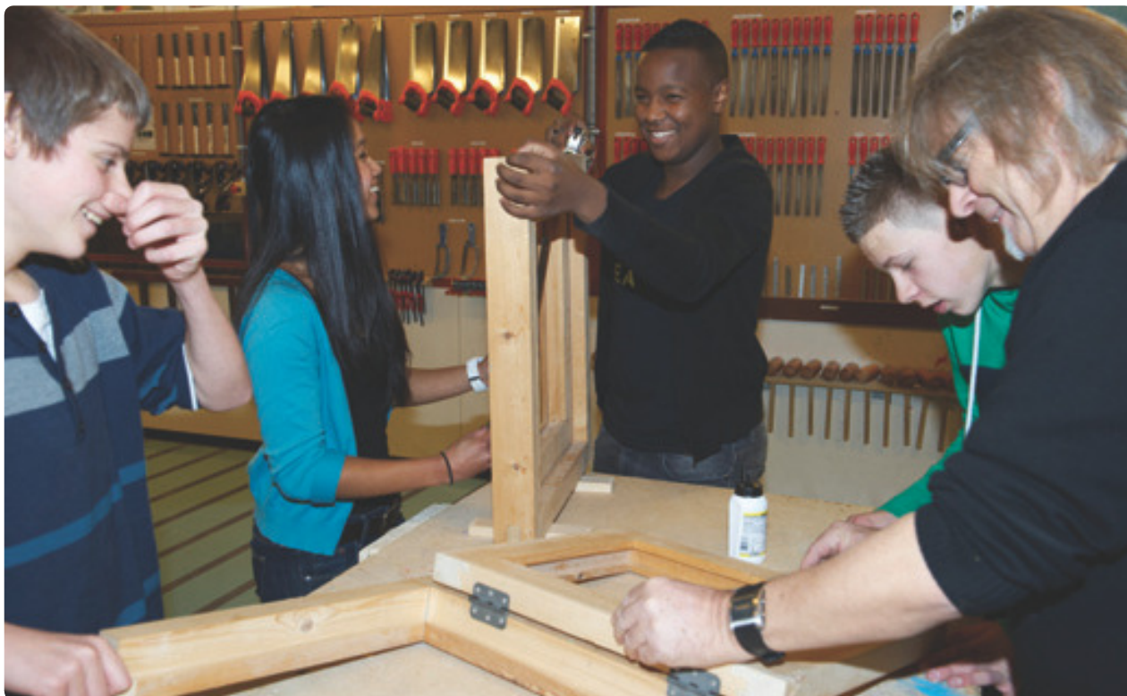
De jongeren op de foto komen niet voor in dit artikel.

Sinds 2014 wordt in Rotterdam geëxperimenteerd met de eerste Nederlandse social impact bond, om werkloze jongeren te begeleiden bij het starten van een onderneming.