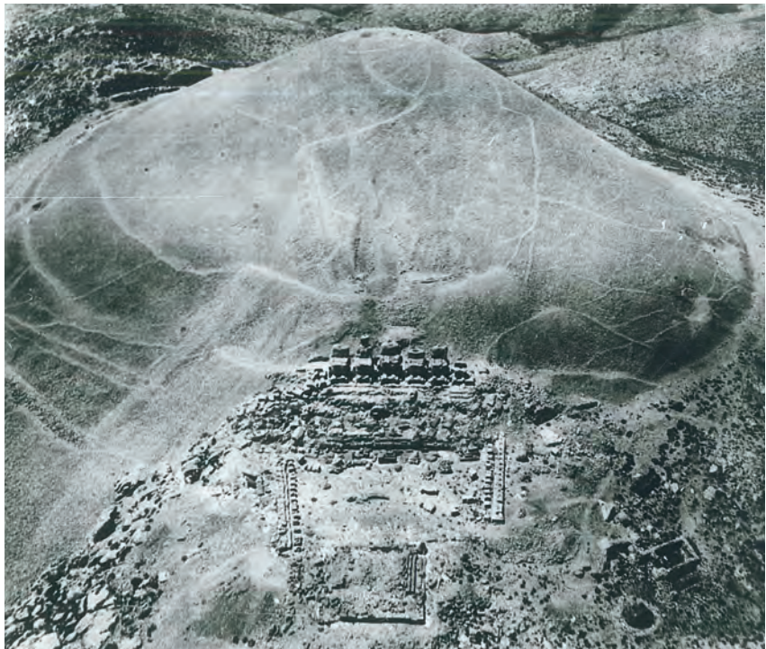
Afb. 2: Nemrud Dağ: luchtopname van de tumulus en het oosterras, daterend uit het eerste helft van de twintigste eeuw

Niemand zal een bezoek aan ‘de Nemrud’ ooit vergeten. Wanneer men na een lange rit door onstuimig berglandschap met aansluitend een fikse klauterpartij eenmaal boven staat, ontvouwt zich een adembenemend panorama. Vanaf deze bergtop op meer dan 2000 meter hoogte kijkt de bezoeker uit over het landschap van het antieke Kommagene (grotweg de huidige provincie Adıyaman), met in de verte het dal van de Eufraat en de toppen van het Taurusgebergte.