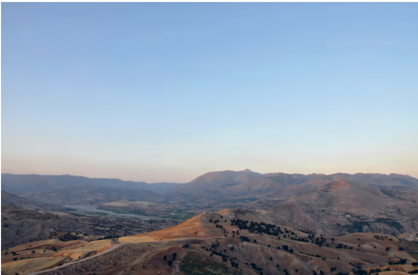
Afb. 1: Gezicht op het Taurusgebergte vanuit de Kommageense laagvlakte. De opvallende tumulus van Nemrud Dağ is duidelijk herkenbaar door de deels artificiële vorm.

Verborgen op grote hoogte in het Taurusgebergte ligt een van Turkijes belangrijkste en meest fascinerende archeologische monumenten: Nemrud Dağ (zie afb. 1). Omstreeks 50 v.Chr. bouwde een zekere Antiochos I, de lokale vorst van een klein koninkrijk genaamd Kommagene, hier een imposante tempel-tombe die in ontwerp en uitvoering getuigt van een groot aantal (culturele) invloeden uit heel Eurazië. Nederlands onderzoek op de berg zelf en op andere sites in het gebied, zoals de antieke hoofdstad Samosata, heeft laten zien dat Kommagene in de Hellenistisch-Romeinse periode een belangrijk kosmopolitisch knooppunt was. Hoe kunnen we dat verklaren? En wat voor rol kan het kosmopolitische karakter van het antieke Kommagene spelen in debatten over identiteit, toen en nu?