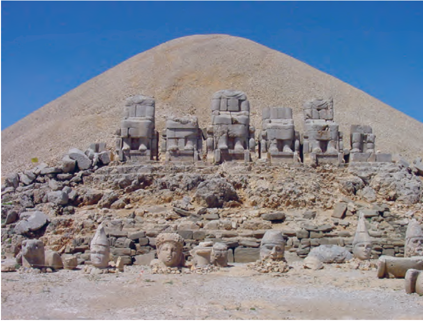
Afb. 3: Nemrud Dag, oostterras, situatie in 2005

kolossaal beeld van de bouwheer Antiochos I zelf (zie afb. 2 en 3). Het vijftal wordt aan beide zijden geflankeerd door een beeld van een leeuw en van een adelaar. Voor dit ensemble stonden oorspronkelijk reliëfs uit zandsteen opgesteld. Op het oostterras resteren hiervan slechts fragmenten. Op het westterras zijn de reliëfs redelijk volledig bewaard gebleven maar daar zijn juist de godenbeelden ingestort, ongetwijfeld door een van de vele aardbevingen die het gebied tot op de dag van vandaag teisteren. Beide terrassen lieten oorspronkelijk dezelfde elementen zien, zij het op verschillende wijze gerangschikt. Naast de kolossale beelden en zandstenen reliëfs vormen de zogenoemde vooroudergalerijen een derde belangrijk onderdeel. Hier presenteerde Antiochos I zijn genealogie door middel van een rij van manshoge reliëfs met altaren ervoor. Van vaderszijde voerde hij zijn afkomst terug op Dareios I, de grootkoning van het Perzische Achaemenidenrijk. Van moederszijde zou hij, via de Seleukiden, afstammen van Alexander de Grote. De vier kolossale godenbeelden waarnaast Antiochos I zich laat afbeelden getuigen van eenzelfde