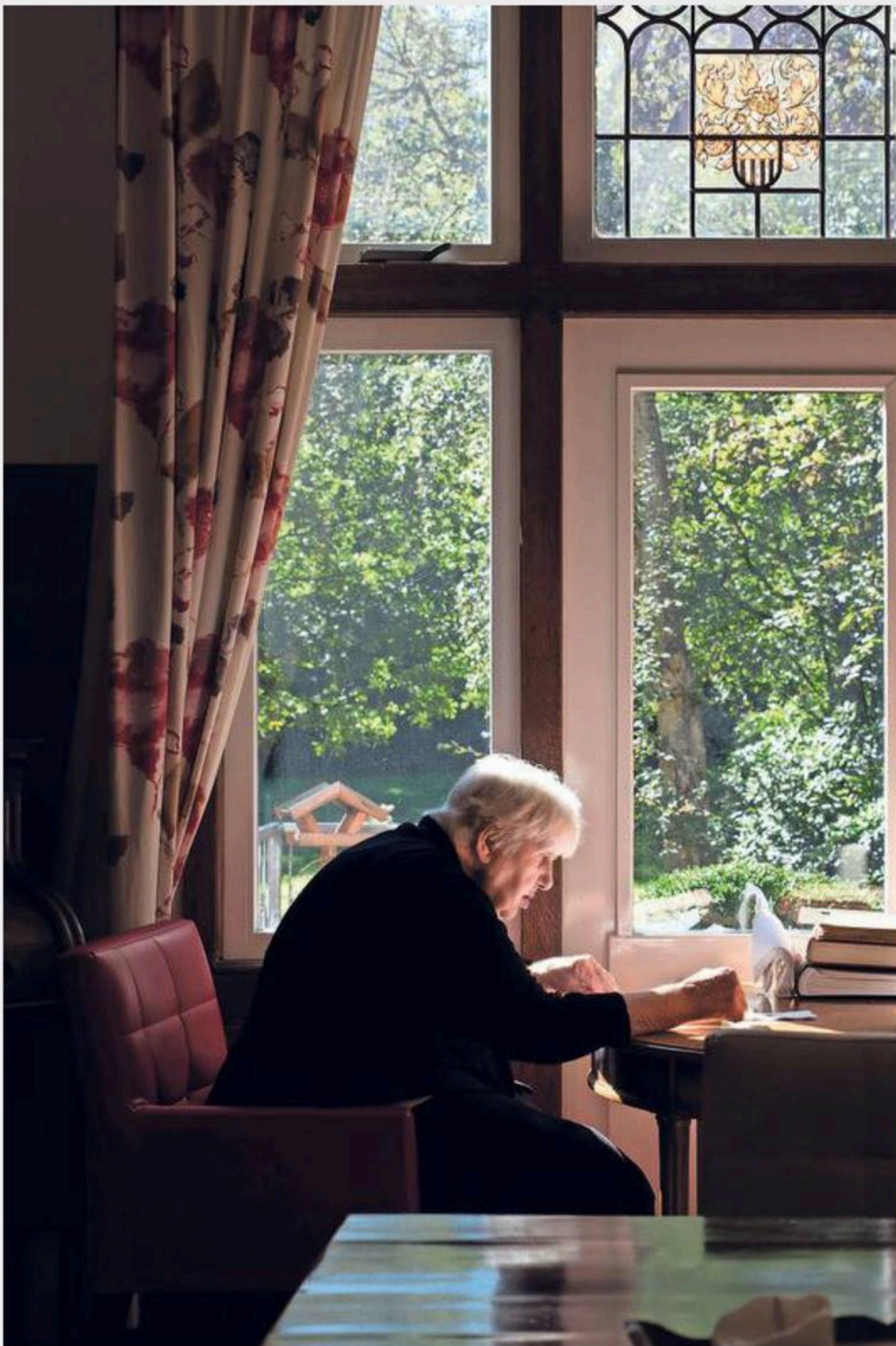
In de woonkamer van de villa leest de mevrouw rustig haar boek.