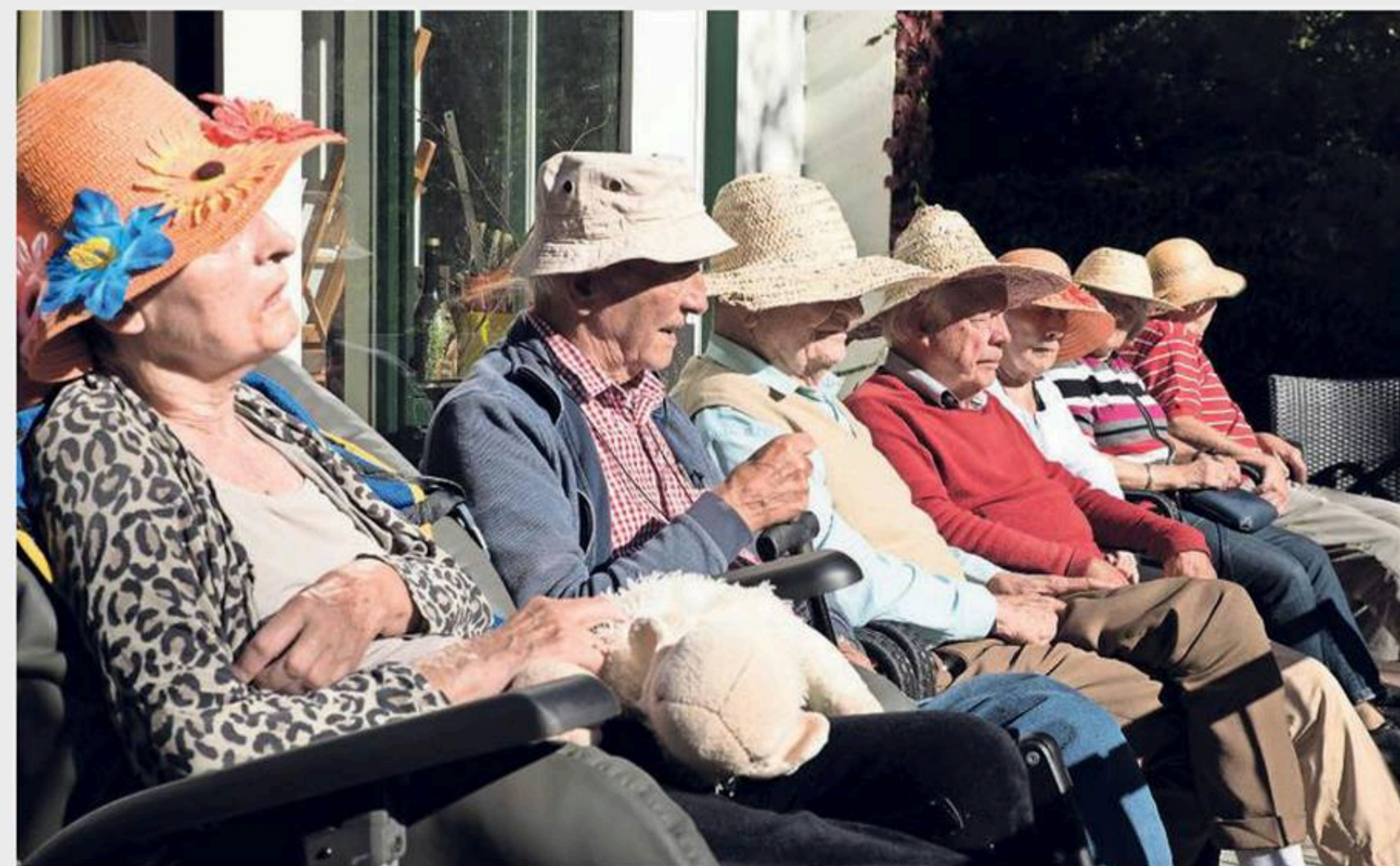
Op het terras van de villa genieten de ouderen van de nazomerzon.

Aan het einde van de dag word ik hartelijk uitgenodigd om aan te schuiven op het terras. Het is een mooie nazomerdag, en de zon is zelfs zo sterk dat de zonhoeden nog een keer uit de kast mogen. Met een wijntje of een glas sap in hun hand zitten de bewoners gezellig op een rij om maximaal van het laatste streepje zon te kunnen genieten. Ze kijken uit op het privébos van de villa. Ik zet ook een oranje zonhoed op mijn hoofd volg het wijze advies van de man naast me op: „Nu nog even genieten, het is zo weer winter.”