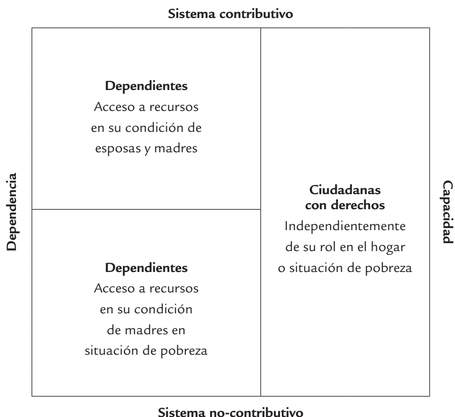
Gráfico 1 Dependencia en el acceso a protección social