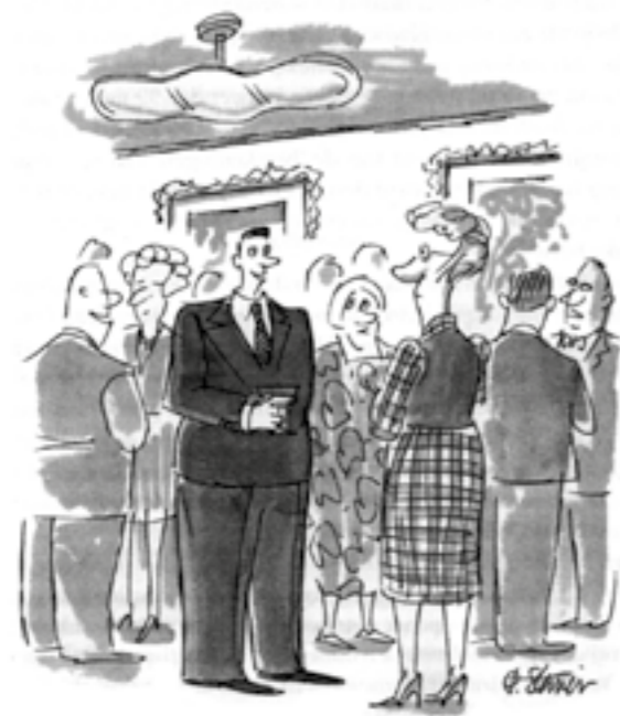
Figuur 2. “Door kleinere, krachtigere chips kan ik me een kleiner hoofd veroorloven” (Kurzweil, 2000, p. 275).

Enkele jaren later schreven Probst, Raub & Romhardt (2002, p. 12): “De reeds lang voorspelde ‘informatiemaatschappij’ en ‘kenniseconomie’ zijn inmiddels realiteit.” In die tijd bezat (bijna) niemand een zakcomputer , zoals smartphones, tablets of notebooks. Sterker: smartphones en tablets bestonden nog niet eens. Tegenwoordig loopt zowat iedereen daarmee rond: in 2013 gingen er wereldwijd meer dan een miljard smartphones over de toonbank (Koenis, 2016).