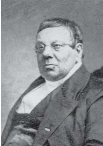
L.C. Luzac.