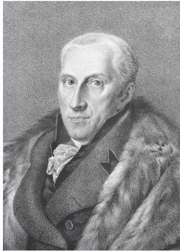
G.K. van Hogendorp.