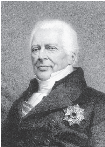
Minister van Justitie C.F. van Maanen.