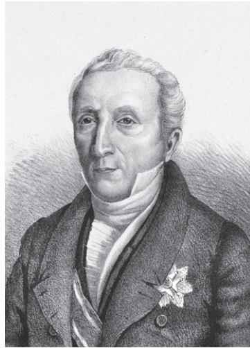
Eerste Kamervoorzitter W.F. Röell.