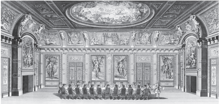
Een vergadering van de Staten-Generaal in de Trêveszaal, omstreeks 1730.