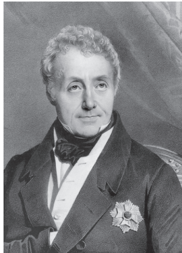
Secretaris van staat A.R. Falck.