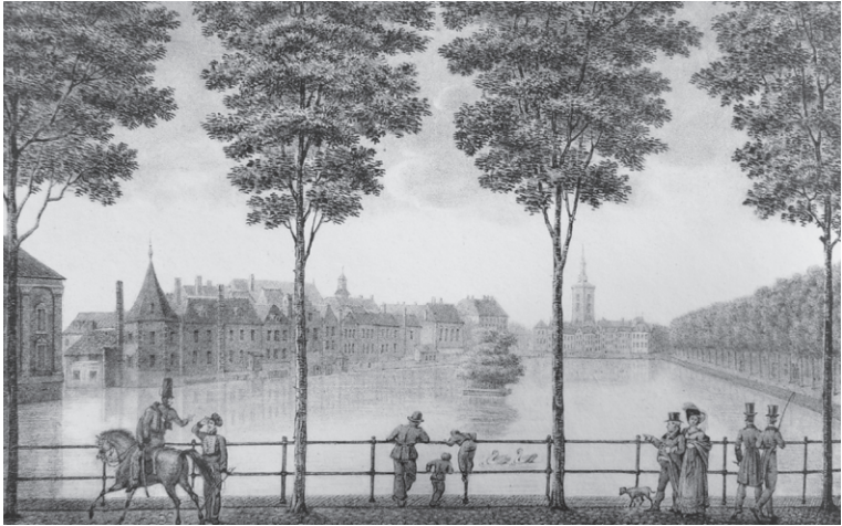
Gezicht op het Binnenhof te Den Haag, omstreeks 1825.