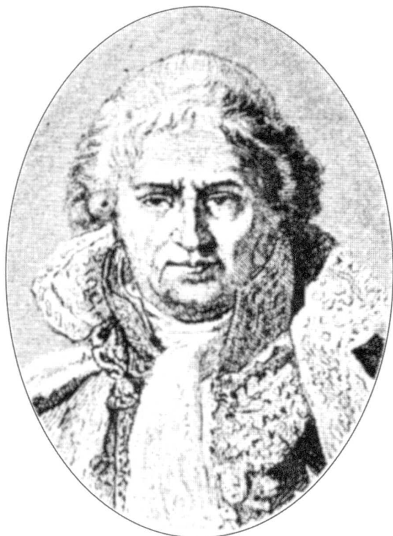
Portret van Jean Étienne Marie Portalis (1745-1807), één van de vier opstellers van de Code civil .

De napoleontische wetgeving was in belangrijke mate een reactie op de vermeende losbandigheid van de revolutionaire tijd. Men zag het potentiële gevaar van echtscheiding voor de maatschappij. Maar voor de opstellers van de Code civil was een terugkeer naar de oude situ-