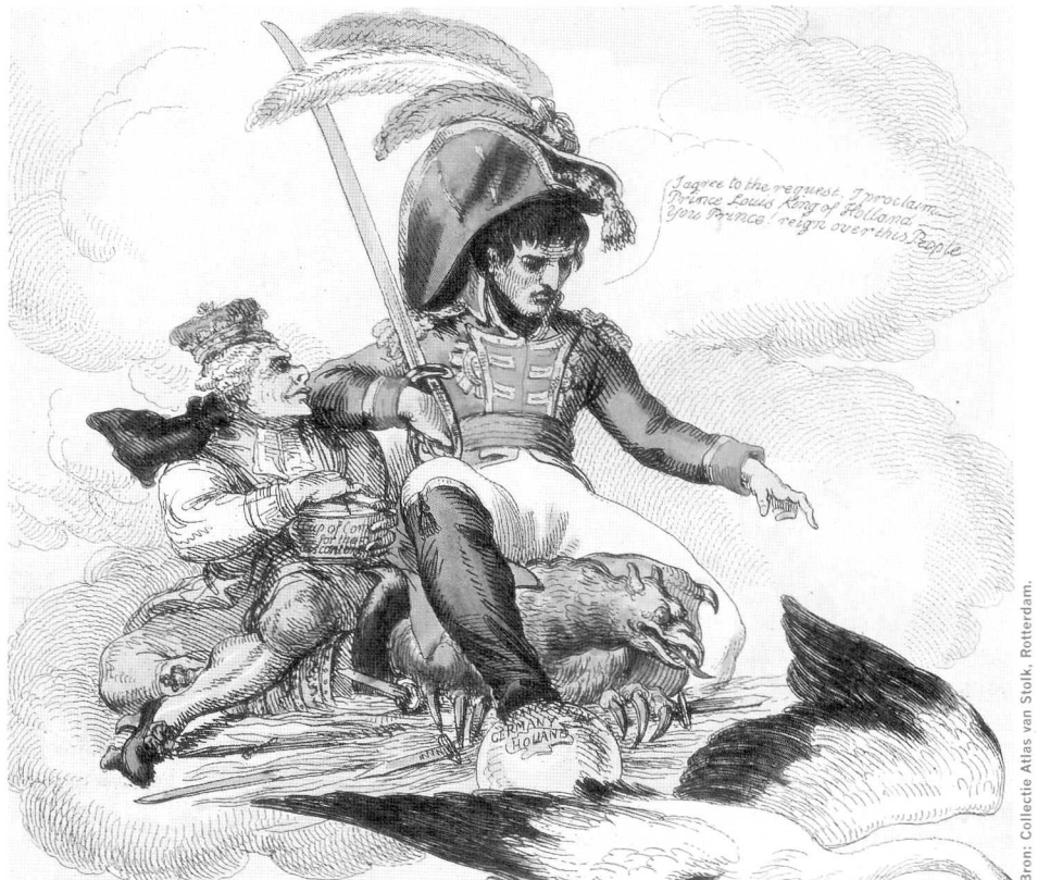
Detail van een spotprent uit 1806, door de Engelsman S. Knight. De keizer wordt voorgesteld als een almachtige god die Europa naar zijn hand zet. In deze karikatuur bombardeert hij zijn broer Louis tot koning van Holland: "I agree to the request. I proclaim Prince Louis King of Holland. You Prince! reign over this People".

Een ander belangrijk punt was het concept meerderjarigheid. Het belang van deze bepalingen was groot want zij stelden vast wanneer de ouderlijke macht eindigde en kinderen handelingsbekwaam werden. Aangezien daarmee een eind kwam aan het door de Code civil zo gewaardeerde gezin, laat het zich raden dat het wetboek hier uitgebreid op inging. De meerderjarigheidsgrens was ook belangrijk aangezien deze direct invloed had op de politieke