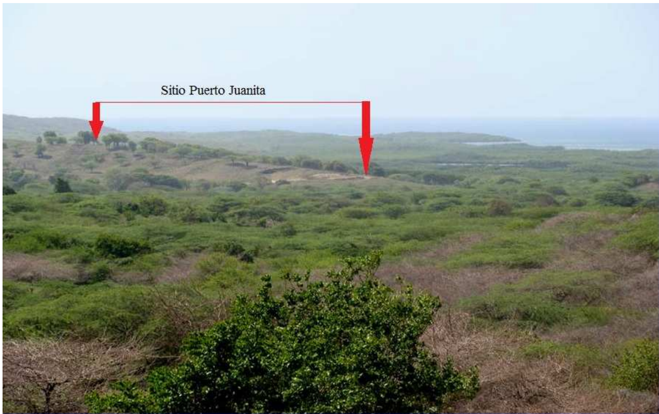
Figura 59. Vista del sitio Puerto Juanita ubicado en la primera línea de asentamientos desde el sitio Papolo localizado en la segunda línea de sitios.

apéndice 3 y capítulo 7 sección 7.4.1). En estos últimos, a pesar de presentarse texturas diversas, se percibe la tendencia hacia una textura predominante y las diferencias con respecto a las de Don Julio, no solo se manifiestan en la composición, sino también en el propio ordenamiento, tamaño y cantidad de granos presentes en ellas. Ese rasgo tecnológico también coincide con la aceptación de manera tímida de los atributos cerámicos Meillacoides por los complejos con cerámica Chicoide, a diferencia de los complejos con cerámica Meillacoide donde la aceptación de atributos Chicoides puede considerarse más acentuada. Esa característica, junto a la ya mencionada incidencia estilística Ostionoide-Meillacoide predominante hacia el este de la región de Punta Rucia, señalan hacia la mayor flexibilidad o mayor interacción de los grupos con cerámica Meillacoide con los portadores de otras cerámicas dentro de la zona. Este aspecto coincide con los mencionados rasgos de su despliegue sobre el paisaje, así como su acceso a espacios vitales, siglos antes del desarrollo de los complejos con cerámica Chicoide dentro del área de estudio.