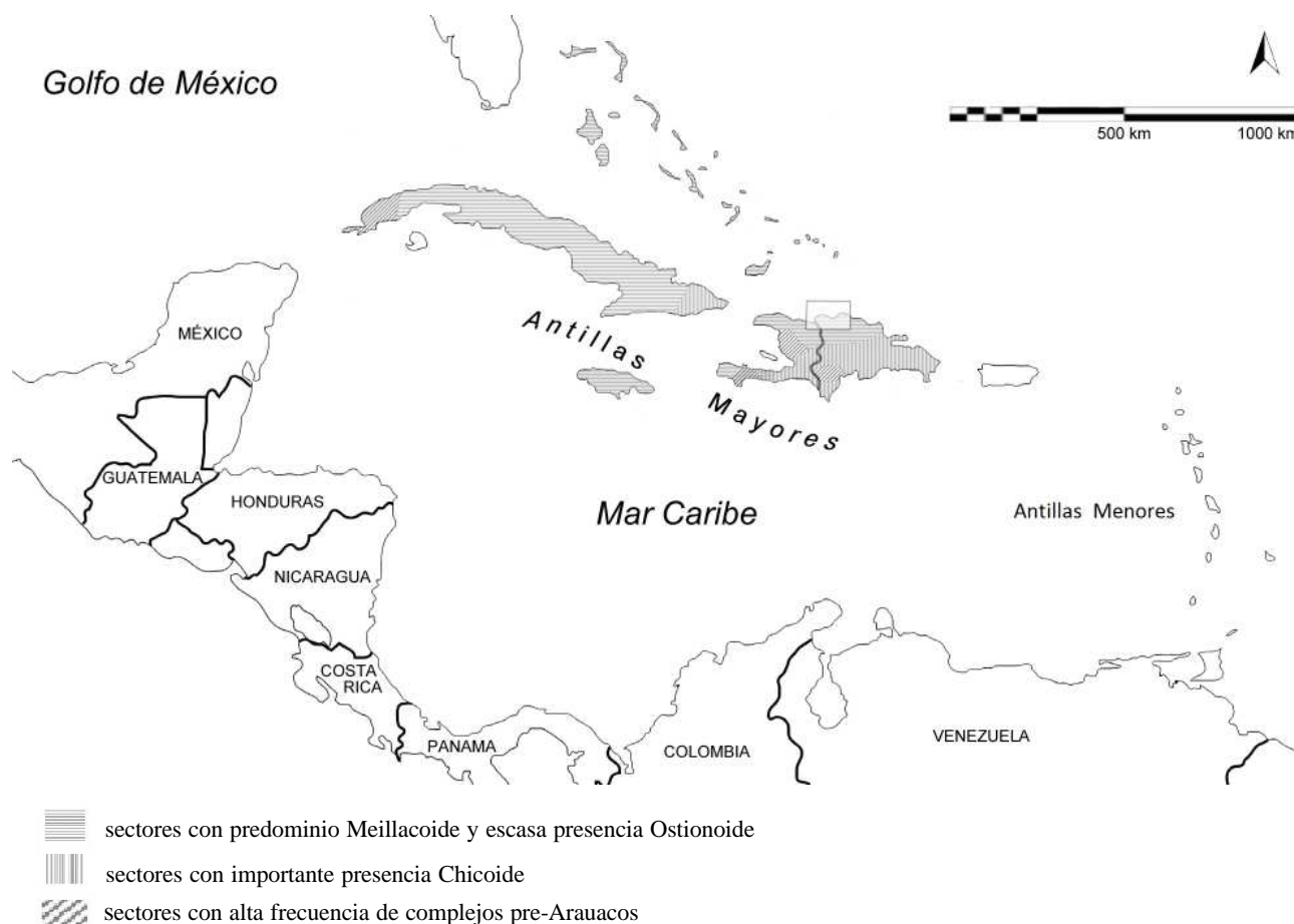
Figura 60. Distribución de las cerámicas predominantes en diferentes sectores del área más occidental de las Antillas Mayores.

mezcla estilística, una presencia importante de materiales foráneos, así como una ubicación estratégica en torno a la explotación de fuentes de materia prima como el jade a partir de la producción de hachas. La trascendencia de esos asentamientos como nodos en las interacciones intra-regionales e interregionales, se demuestra porque la mayor parte de ellos son sitios de larga cronología, lo que indica la necesidad del control sobre esos espacios, incluso en algunos de ellos puede encontrarse material europeo, lo que refleja su trascendencia hasta momentos bien avanzados, pero además reitera su rol en la circulación de distintos bienes.