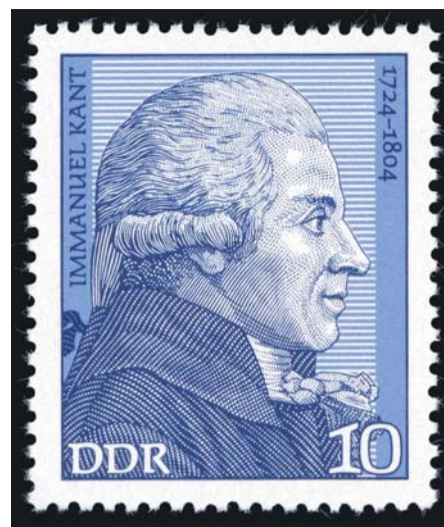
Immanuel Kant op een postzegel uit de voormalige DDR.

Deze cognitiewetenschappers trachten, in aansluiting op de fenomenologische traditie, de alledaagse subjectieve ervaring in hun analyse mee te nemen. Zij begrijpen organismen in termen van zichzelf organiserende dynamische systemen waaruit op complexere niveaus nieuwe eigenschappen ontstaan ('emergentie'). De vroegste wortels van cognitieve zoekers zijn bij de begrenzing van elementaire levensvormen en de overschrijding daarvan. Dáár begint immers de confrontatie met de buitenwereld. Dit sluit goed aan bij Plessners analyse van het centrisc functioneren van dieren (het darwinistische aspect van zijn werk), maar minder bij zijn analyse van de menselijke excentrische positie (het kantiaanse aspect). Naar de smaak van de embodiment -aanhangers beschouwt Plessner de menselijke excentrische positie te zeer als een innerlijk theater – in de zin van de Amerikaanse filosoof Daniel Dennett – waarin een mensje zou zitten dat op alles wat binnenkomt reageert, zoals Descartes het voorstelde. Dat is volgens deze neurowetenschappers precies wat cognitie niet is.