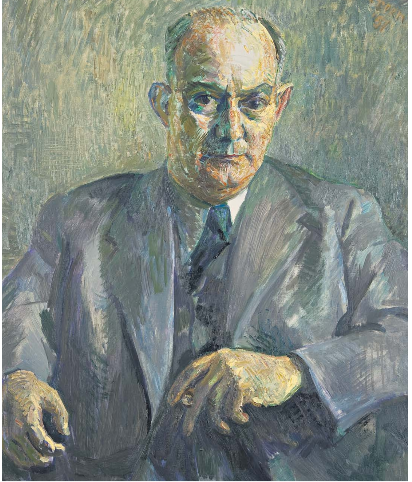
Helmut Plessner, door Paul Citroen (1951).