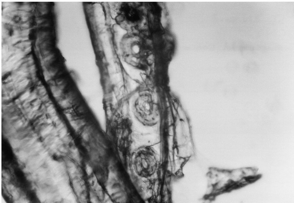
Fig. I.2 Residue from an artefact from San Isidro: radial fragment of pinewood with bordered pits, a- orig. magn. 100X, b-200X