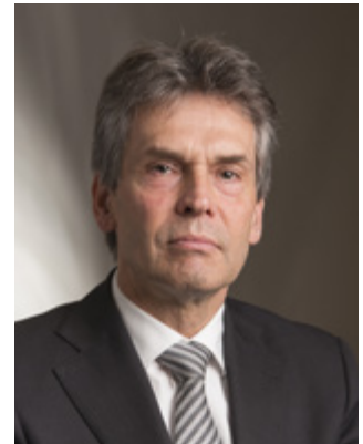
Dick Schoof Nationaal Coördinator Terrorismebestrijding en Veiligheid