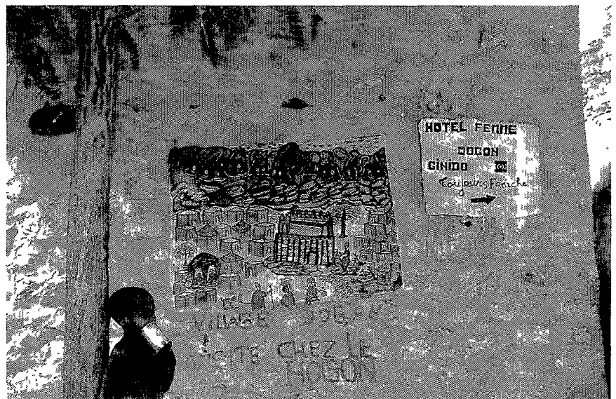
Het hotel Femme Dogon Gindo te Tireli

Reizigers komen al heel lang naar dit verre oord in de Malinese Sahel. Het eerste hotel in Sangha, vanouds een case de passage van de Franse regering, dateert al van voor de Eerste Wereldoorlog. Op zich zouden de moeilijke toegang tot het gebied en het hete klimaat het ongeschikt kunnen maken als toeristenbestemming, maar dat wordt meer dan goed gemaakt door de visuele rijkdom. Met zijn welverdiende reputatie plus zijn erkenning als Werelderfgoed door de Unesco, is het Dogongebied een bezienswaardigheid geworden die geen bezoeker van West-Afrika mag overslaan, of het nu een veteraan is of een debutant in het reizen. Hierbij komt nog de Dogonetnografie van Griaule en zijn collega's. Griaule schilderde het beeld van een mystieke en poëtische Dogoncultuur, slechts te begrijpen vanuit een ingewikkelde en verborgen scheppingsmythe, dat prachtige verhalen genereerde voor de toeristen. Zijn publicaties zijn gemeengoed geworden en zowel toeristen als gidsen hebben zich dit