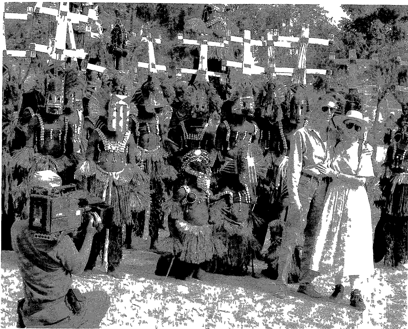
Toeristen met Dogondansgroep te Sangha

beeld van een mysterieuze en exotische cultuur snel eigen gemaakt. Het feit dat dit beeld ver staat van de realiteit boeit weinig toeristen en nog minder gid sen 3 . Al zijn sommige toeristen teleurgesteld wan neer ze de Dogon alleen maar over geld horen spre ken (een logisch onderwerp trouwens tussen bezoekers en plaatselijke bevolking), de meesten accepteren dat als deel van het exotische waarop ze gerekend hadden. Een toerist verwacht juist ver borgen dimensies, en iets exotisch levert betere verhalen op dan het gewone. En ook de gidsen in het Dogongebied zelf hebben die verborgen dimen sies aan hun eigen verhalen toegevoegd.