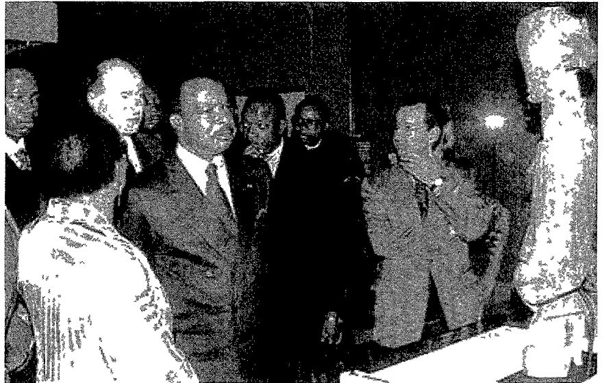
President Denis Sassou-Nguesso brengt een eerbetoon aan het Batékébeeld in het Parijse Musée des Arts Africains et Océaniens

Afrika worstelt met de staat, als instituut en als identiteit. Burgers zien er de voordelen niet van in - niet verwonderlijk gezien zijn droevige prestaties tot nu toe. In de oneindige discussies over de problemen van de staat in Afrika schittert de Republiek Congo (Brazzaville) door afwezigheid. De laatste maal dat we er van vernamen, was in 1997 en begin 1999. Een korte maar hevige gewapende strijd tussen milities (zich noemende de Ninja's, de Cobra's en de Zulu's) van de toenmalige politieke leiders luidde het einde in van het democratiseringsproces dat in 1991 begonnen was, en leidde tot de verdrijving van de 'democratisch' gekozen president Lissouba. De strijd werd gekenmerkt door ongekende felheid, plundering en vernietiging van vele buitenlandse, met name Franse, bezittingen. Tegen de twaalfduizend mensen vonden de dood. Lissouba zit zich nu te verbijten in ballingschap in Londen, terwijl zijn oude rivaal, ex-dictator Denis Sassou-Nguesso, weer de macht heeft. Wat is er aan de hand in dit anders zo onopvallende Centraal-Afrikaanse land? Was er ooit een echte staat en zo ja waarom is die zo kwetsbaar gebleken voor het geweld van private milities?