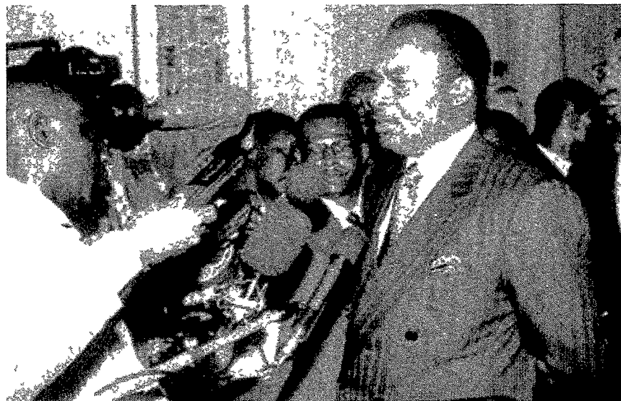
President Denis Sassou-Nguesso in Ouagadougou, 1998

de totale bevolking woont in de steden, zoals Brazzaville (met in rustiger tijden ongeveer 900.000 inwoners) en Pointe Noire (de handels- en havenstad, ca. 280.000). Het midden en noorden van het land zijn schaars bevolkt en nog voornamelijk oerwoud. (Het tafereel van de opgeblazen reisverhalen van de Brit Redmond O'Hanlon [1997] die daar wilde aantonen hoe flink hij wel niet was, als goed geoutilleerde avontuur-toerist.) Bijna 90 procent van de jeugd in Congo doorloopt minstens de lagere school en het analfabetisme is zeer laag: een unicum in Afrika. De bevolking is sterk politiek bewust. De Congolese vakbeweging is goed georganiseerd en heeft altijd een politieke rol van betekenis gespeeld. Congo kent een veelheid van, ook in aangrenzende landen levende, etnisch-culturele groepen (waaronder de Kongo, de Teke, de Mbochi, de Kota en de Mbeti), maar van een politieke organisatie op 'etnische' grondslag was niet of nauwelijks sprake tot 1993-4. Etnische diversiteit heeft op zich niet geleid tot de crisis van de staat, hoe graag de westerse media dat ook altijd willen beweren ('stamconflicten' en zo). Een voorbeeld: in het conflict van de laatste jaren speelt de Nibolek-bevolking een grote rol.