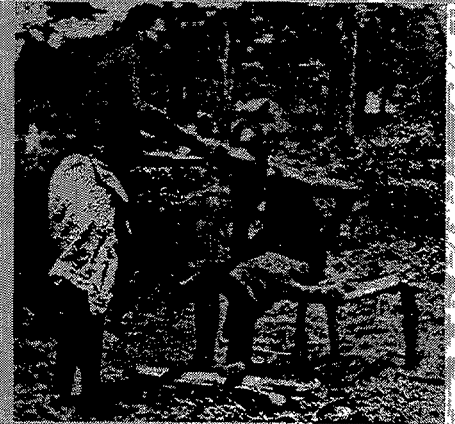
Een man, verdacht van heksenj, wordt 'medicin' gegeven om te bepalen of hij schuldig is of niet.