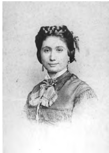
Links: De Said-Ruete Collectie in de NINO-bibliotheek in Leiden. Rechts: Prinses Salme, Emily Ruete, in Dresden (1872).