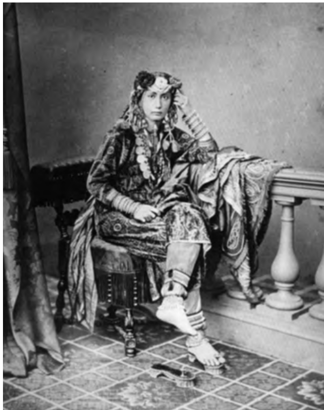
Prinses Salme, Emily Ruete (Hamburg, ca. 1868).