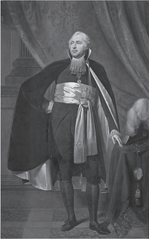
Afb. 16 Staatsieportret van Schimmelpenninck, door Charles Howard Hodges, 1805, particuliere collectie familie Schimmelpenninck, het Nijenhuis, Diepenheim.

Uit vele hoeken kwam kritiek op Schimmelpenninck en zijn medewerkers. Besier en Spoor, de politiek meest uitgesproken leden van het Staatsbewind, hadden geen functies in het nieuwe bestel gekregen. Ze voelden zich door Schimmelpenninck in de steek gelaten en stelden zich kritisch op. Zo merkte Besier op: ‘Het behaagt ook niet dat Schimmelpenninck op het Huis in ’t Bosch gaat wonen en hetzelfde voor de wandelaars sluit. Het livrei van den Staat zal zijn rood met goud, en is reeds voor negen knechts besteld. Zulk eene hofhouding kan bij ons niet smaken.’ 11 Laatdunkend schreef hij over de raadpensionaris dat ‘de man zwak is en niet hij maar de ministers regeeren zullen.’ 12 Hij was nogal gebeten op Gogel die hij ervan had beschuldigd zijn politieke val te hebben bewerkstelligd: ‘Van Gogel hoor ik