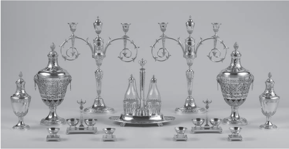
Afb. 15 Gedeelte van het 26-delig zilveren servies, gemaakt door François Simons, in 1803-1804 door het Staatsbewind aan Gogel geschonken, als dank voor aan het land bewezen diensten, Rijksmuseum, Amsterdam, BK-14590-04.

Staatsbewind er toch mee zou instemmen. 130 Zo gebeurde het en Gogel ontving het servies in mei 1804. De beide firmanten van het Rotterdamse handelshuis Haveelaar, die een soortgelijke, maar kleinere operatie hadden uitgevoerd, kregen elk een snuifdoos van circa 500 gulden.