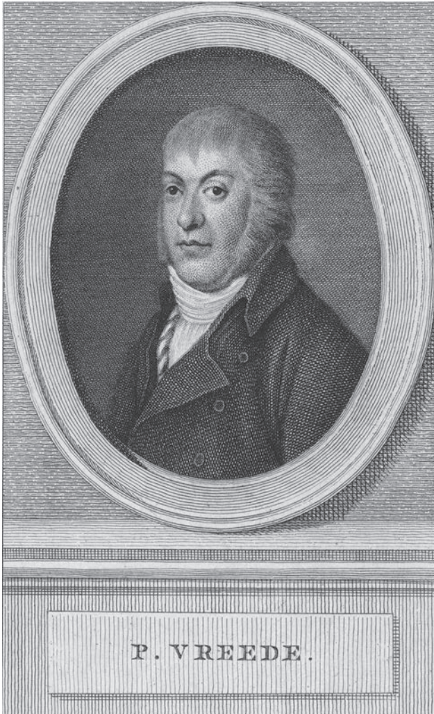
Afb. 7 Portret van Pieter Vreede, prent door Reinier Vinkeles, naar een schilderij van Monogrammist, T.L., ca. 1800, Rijksmuseum, Amsterdam, RP-P-OB-62.976.

telen adviseerden het Ontwerp te verwerpen. Tegelijkertijd deden ze een frontale aanval op de Nationale Vergadering: er kon geen goed Ontwerp tot stand komen, zolang het oude Reglement van kracht was. De redactie van De Democraten deed mee, zonder namen te noemen, dat de vrij grote groep die in redactionele zin bij het blad betrokken was, verdeeld was. Sommigen waren tegen het ontwerp, anderen wisten het nog niet. Enkelens zouden mogelijk voor het ontwerp stemmen, omdat een verwerping ook nadelen met zich meebracht. 110 De Sociëteit voor Eenheid en Ondeelbaarheid publiceerde echter een volstrekte afkeuring van het ontwerp. 111