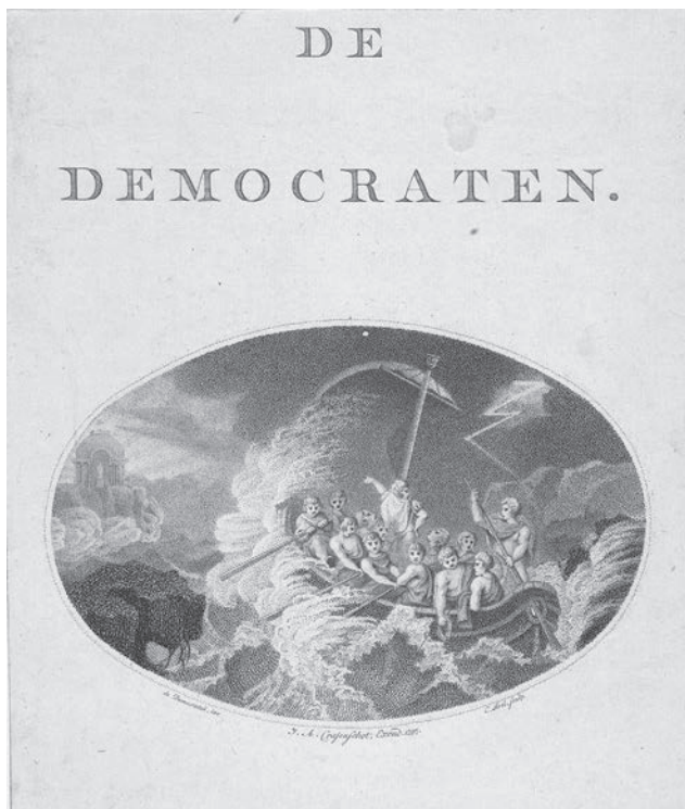
Afb. 6 Allegorisch titelvignet van het tijdschrift De Democraten , prent door Christiaan Josi, naar een ontwerp van de redactie, 1797, Rijksmuseum, Amsterdam, RP-P-OB-86.630. Een groep mannen roeit in een boot op zee tijdens een storm, hun bestemming in de verte is de ideale staat, verbeeld door een tempel aan de kust ( Het Bataafse experiment , 75).

Tussen eind juni 1796 en begin februari 1798 verscheen De Democraten ruim negentig maal, gewoonlijk op donderdag. De artikelen in het blad waren anoniem. Alleen van Gogel en Ockerse staat onomstotelijk vast dat zij belangrijke bijdragen leverden. Verder is van Van Hall bekend dat van hem bijdragen werden opgenomen, vooral in de vorm van gedichten onder het pseudoniem Brutus. 58 In een brief van 3 februari 1798 waarin Ockerse op de oprichting van het blad terugkeek, sprak hij Gogel aan als medeoprichter en co-redacteur. 59 Ockerse herinnerde er toen aan dat de eerste twee nummers gezamenlijk door de beide redacteuren waren geschreven en dat de inhoud als een soort beginselverklaring kon worden beschouwd. Uit de brief valt af te leiden dat zij ook daarna de voornaamste redacteuren waren, maar dat er wel sprake was van een gemeenschap van medewerkers en lezers. Ockerse gebruikte zelfs de term broederschap.