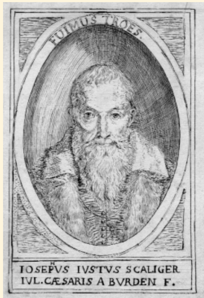
FOTO BOVEN Hendrick Goltzius, Portret van J.J. Scaliger , kopergravure, 1593; afdruk door Dirck Harting uit 1913. [UB plano 68 D 7].

FOTO ONDER Onbekende tekenaar, Portret van J.J. Scaliger , pen en grijze inkt. [coll UB].