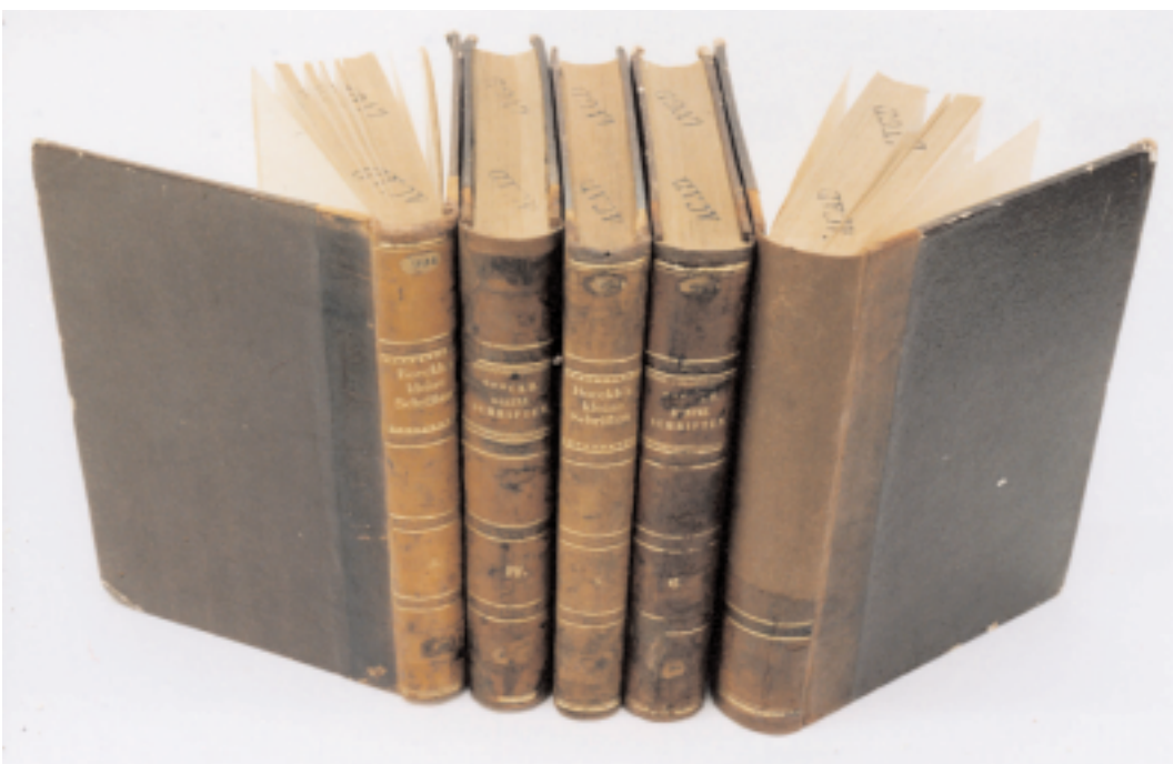
Banden van August Böckh, Gesammelte Kleine Schriften , voor en na de restauratie [UB E 26-30].

Voor het project van de studenten was de beslissing snel genomen. Zou ik ze klassieke rugvernieuwingen willen laten uitvoeren, dan zouden ze één of twee boeken kunnen behandelen in de week dat ze hier kwamen werken. Door te kiezen voor conservering met Japans papier zouden ze zeker vier tot zes boeken kunnen herstellen.