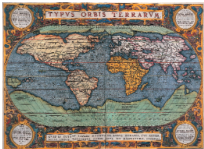
Typus orbis terrarum. Ab. Ortelius describ[ebat] cum privilegio decennali 1587. [Schaal circa 1:83.000.000, ovale projectie]. Kopergravure, gekleurd, 355 x 490 mm. In: A. Ortelius, Theatrum orbis terrarum . Antverpiae, officina Plantiniana, 1592 [COLLBN Atlas 41].