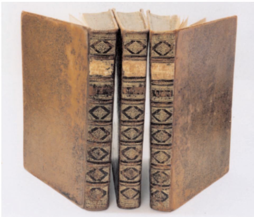
Histori der Nederlandsche Vorsten [UB 417 A 1-3] voor en na de restauratie.