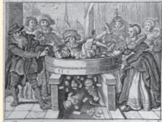
FOTO LINKS Vrolijk gezelschap. Ets uit J. Cats, Houwelyck, Dat is De gantsche gelegentheit des Echten-staets . 2e druk. 's-Gravenhage, Adriaen van de Venne en de Joost Oeckersz., 1632 [UB 1019 D 16].

Veronderstellingen in deze richting werden eigenlijk pas inzichtelijk bij het doornemen van verschillende werken van Cats in het Museum Catseanium, juist omdat daar zo'n groot aantal edities bijeen is gebracht. Dat maakt het kijken en vergelijken namelijk bijzonder uitnodigend,