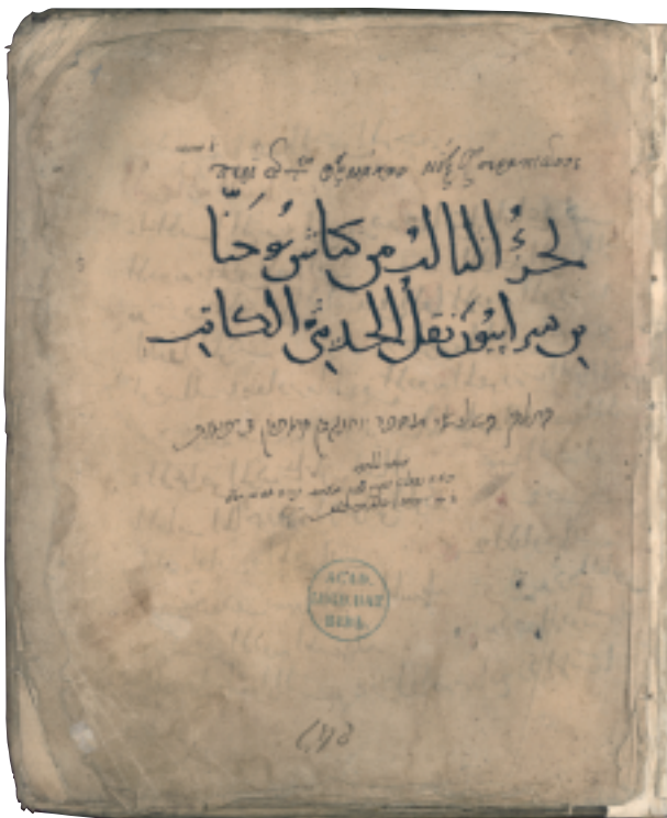
Title page of Ibn Serapion's Small Compendium . The title is given in Greek (Περὶ τῆς τῶν φαρμάκων μίξεως Σεραπίωνος); Arabic (الجزء الثالث من كتاب يوحنا بن سريون الحديثي الكاتب); and Hebrew (ברפואות סראפיון בן יוחנן מספר השלישי החלק). [Or. 2070 fol. 1a].

area of Ibn Serapion's therapy: he includes many recipes with Indian ingredients, or of Indian origin. This reflects the cosmopolitan nature of the Abbasid Empire with its thriving capital Baghdad, where he probably worked.