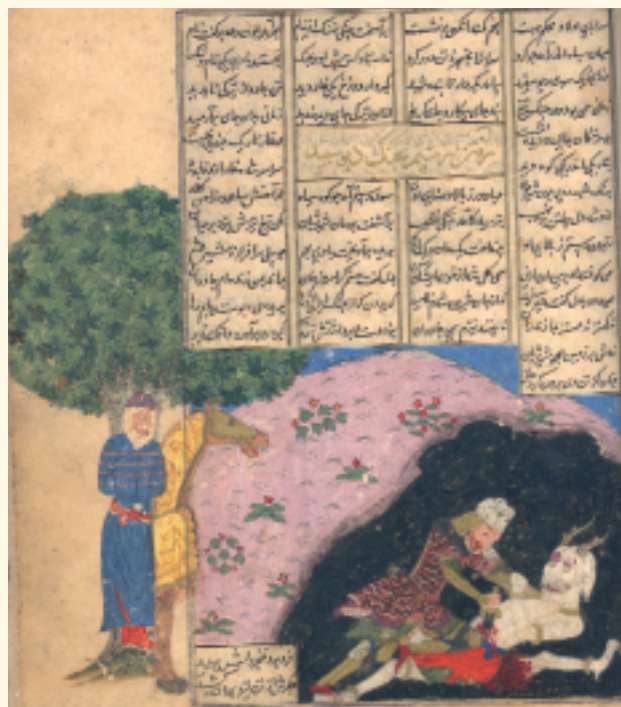
Shahnama (1437), Rustam verslaat de Witte Demon [Or. 494 f. 67r].