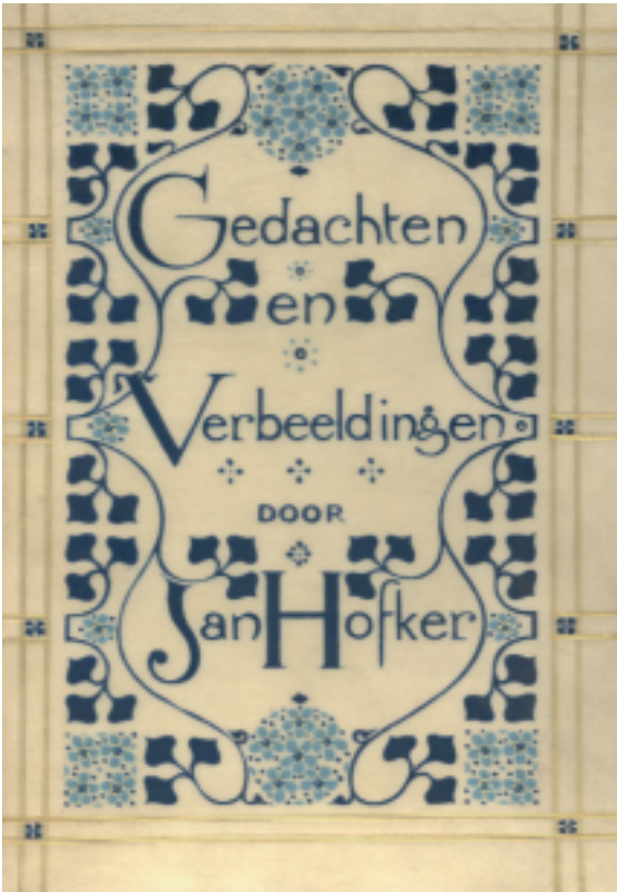
Jan Hofker, Gedachten en Verbeeldingen , Amsterdam, S.L. van Looy 1906. Bandversiering door Th. Nieuwenhuis. [22.538 F 6].