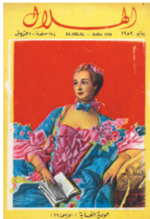
Het Egyptische tijdschrift Al-Hilal met madame de Pompadour op het omslag, juli 1959. [UB s 589].

Deze tentoonstelling kan niet los worden gezien van een eerdere tentoonstelling van Oosterse gedrukte boeken. In de winter van 2000/2001 toonde de bibliotheek onder de titel Duistere machten: gestalten van het kwaad in de wereld van de islam de extreme kant van de islam: de op hol geslagen vroomheid, de haat tegen andersdenkenden en de afkeer van het Westen. Dat was enkele maanden voordat die gevoelens zich op bloedige wijze zouden uiten in de aanslag op de Twin Towers . Om een evenwichtig beeld te geven gaat het ditmaal om boeken die de andere kant van het spectrum laten zien.