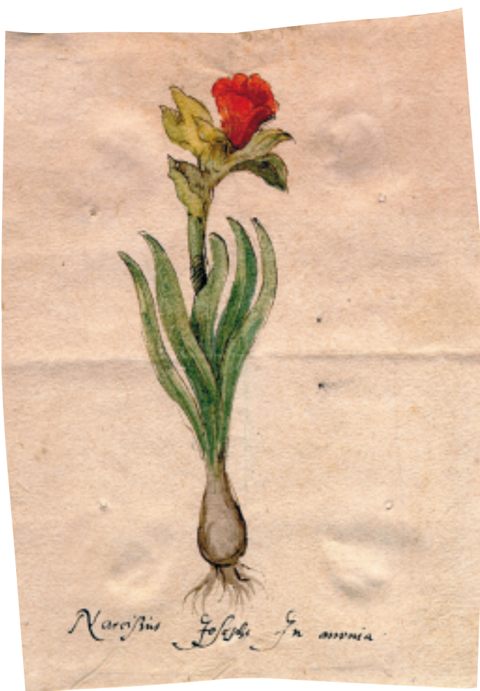
FOTO BOVEN Tekening van een narcis door Carolus Clusius in een brief aan Matteo Caccini [BPL 2724 14].

De eerste stap op weg naar een grootschaliger onderzoek is de digitale beschikbaarstelling van de enkele honderden Leidse Clusius-brieven op het Internet. Zo worden geleerden uit heel Europa in de gelegenheid gesteld ongepubliceerde bronnen te raadplegen, zonder naar Leiden te hoeven afreizen. Tegelijkertijd kan zo langs elektronische weg een team van her en der gestationeerde wetenschappers gezamenlijk werken aan de thematische ontsluiting of zelfs aan een gemeenschappelijke editie van de brieven. Zo hopen de Universiteitsbibliotheek en het Scaliger Instituut een eerste bijdrage te kunnen leveren aan de nieuwe context voor Clusius, waarvan de eerste contouren zichtbaar zullen worden op een congres over de botanicus dat volgende zomer ook in Leiden zal plaatsvinden.