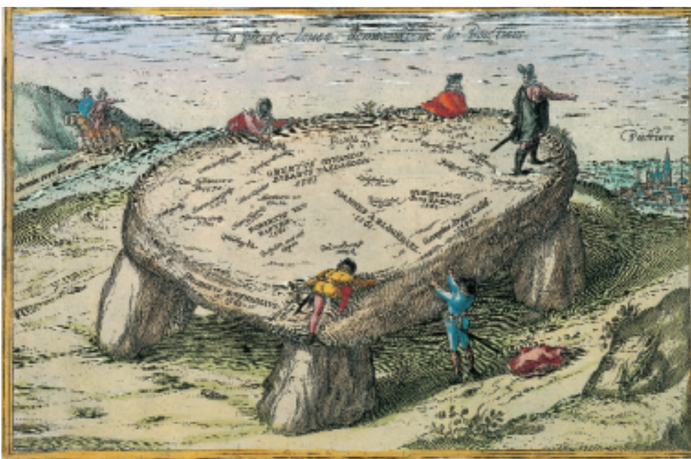
Joris Hoefnagel, De ‘Pierre-levée’ bij Poitiers. Gravure uit G. Braun & F. Hogenberg, Civitates orbis terrarum. Keulen 1575-1618.

De kunstenaar die zijn werk als het ware ‘signeert’ door zichzelf in de marge van de voorstelling kijkend naar zijn object af te beelden – het is een motief dat in de geschiedenis van de kunst tot verrassende inventies heeft geleid (denk bij voorbeeld aan het gezicht van Van Eyck dat zichtbaar is in de ronde spiegel op het Arnolfini-portret). In het geval van Hoefnagel evocert het motief de langdurige, avontuurlijke, uitputtende en gevaarlijke reis langs