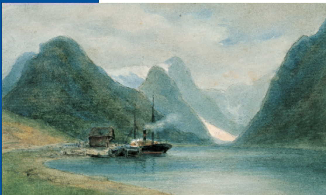
H.A. van Trigt, De Fjaerlandfjord , aquarel, 145 x 230 mm. (PK 1966-T-9/65).

Van Trigt had Noorwegen 'ontdekt' op een reis in 1865. Samen met zijn Vlaamse collega's Henri Wüst en Léon Bource reisde hij toen langs de kust van Noorwegen tot aan Lapland. Volgens Carel Vosmaer, die Van Trigts biografie opnam in Onze hedendaagsche schilders (1881),