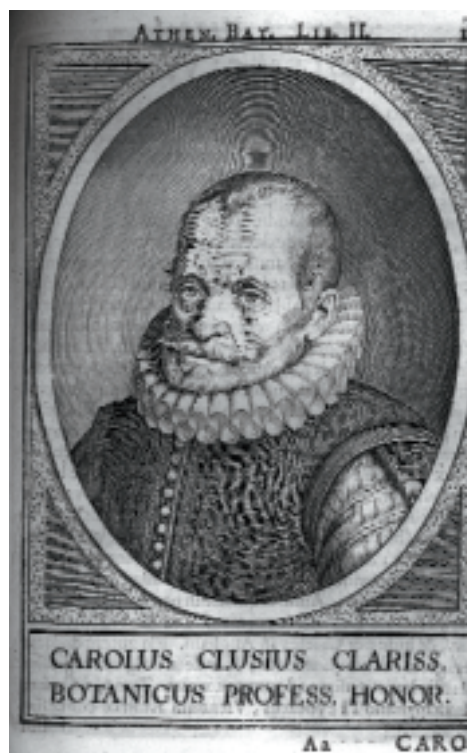
FOTO ONDER Portret van Carolus Clusius uit Johannes Meursius, Athenae Batavae [...]. Leiden, A. Clouck & Officina Elzeviriana 1625. [UB 662 c 10].