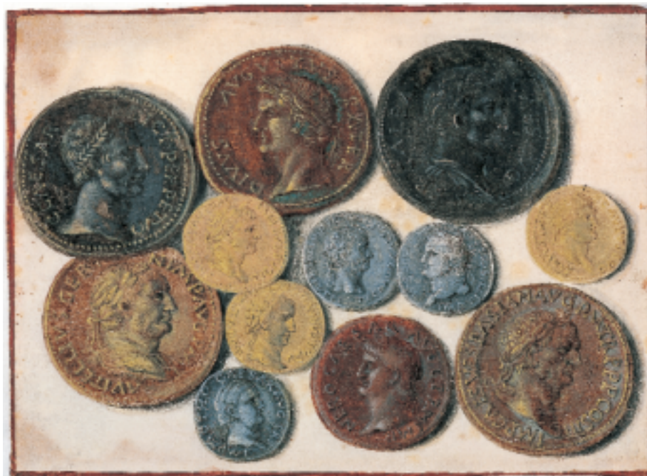
Joris Hoefnagel, Romeinse munten . Aquarel en dekverf op perkament, 93 x 126 mm. [Coll. Prentenkabinet UB Leiden].

In september bezochten de twee reizigers de beurs in Frankfurt, het Europese centrum van de handel in boeken, kunstvoorwerpen en kostbare stoffen, begin oktober waren zij in Augsburg, de stad van de Fuggers, de schatrijke bankiers die aan de top stonden van een wijdvertakte 'multinational'. Ortelius en Hoefnagel bewonderden het paleis van de Fuggers met zijn marmeren feestzaal en zijn beroemde bibliotheek met de aanpalende 'Kunstkammer', die behalve exotische schelpen, struisvogeleieren, bezaarstenen, eenhoorn-hoornen en nog veel meer ook een fabuleuze verzameling antieke munten herbergde. Vooral die laatste collectie moet Ortelius hogelijk hebben geïnteresseerd. Hij bezat immers ook zelf een belangrijke verzameling munten, waarover hij in 1573 bij Plantijn een boek had laten ver-