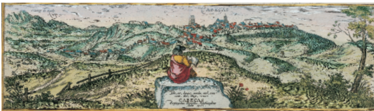
Joris Hoefnagel, Gezicht op Cabeças. Gravure uit G. Braun & F. Hogenberg, Civitates orbis terrarum. Keulen 1575-1618.

's Heren wegen die moest worden volbracht om de afgebeelde stad in den vreemde in zicht te krijgen. En dit was precies de formule waaraan het succes van de Civitates orbis terrarum te danken was: het was een boek voor 'armchair travellers', voor 'Fingerwanderer', voor thuisblijvende reizigers-in-de-verbeelding.