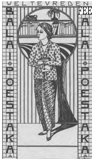
Reclame Balai Poestaka

De activiteiten van Volkslectuur op publicatiegebied met betrekking tot de Maleise taal begonnen aldus slechts aarzelend, voornamelijk door het reeds vermelde gebrek aan belangstelling. Nadat Rinkes de leiding had gekregen, werd weliswaar duidelijk dat hij ernaar streefde om de Maleise taal te bevorderen, maar hij werd in zijn pogingen belemmerd door een aantal praktische problemen. Het gebrek aan bronnen was daar slechts één van. Een belangrijk obstakel waarmee de net opgezette Maleise afdeling van Volkslectuur echter te maken kreeg, was het grote gebrek aan