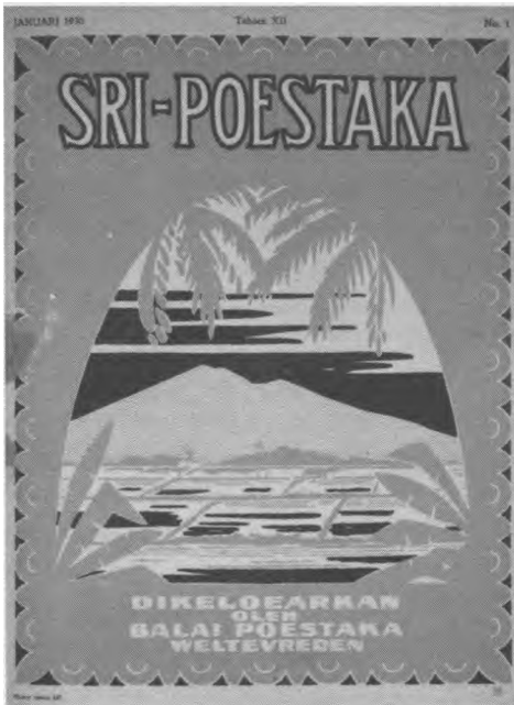
Omslag Sri Poestaka (1930)

Hoewel Aeusrivongse (1976:16) beweert dat 'it is likely that the Balai Poestaka had no definite policy to establish supreme importance of any particular language over