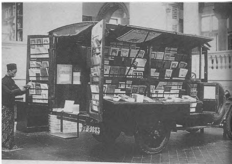
Een boekenauto van Volkslectuur