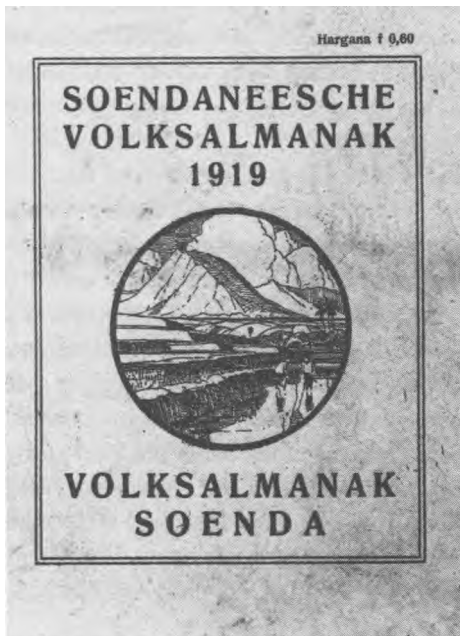
Omslag Soendaneesche Volksalmanak (1919)

Maleise boeken werden ter beschikking gesteld aan alle leeszaal en bibliotheken onder beheer van Volkslectuur, terwijl de publicaties in de regionale talen alleen in voorraad waren in de bibliotheken van de desbetreffende taalgebieden (zie tabel 2 en 3). Hoewel ze niet waren uitgekozen als het belangrijkste 'medium van modernisering', werden de regionale talen en hun literaire producten echter niet geheel buiten het moderniseringsproces gehouden. 25 Sommige van de hierboven opgesomde ter-