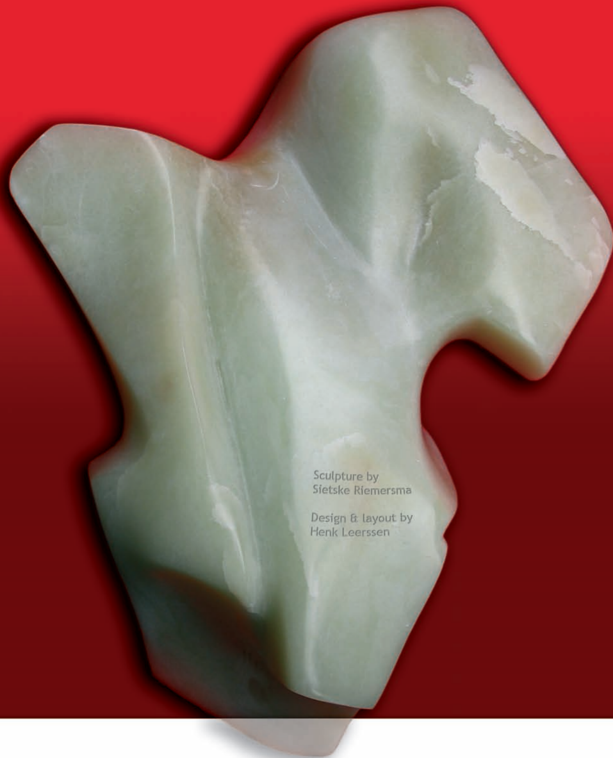
Sculpture by Sietske Riemersma Design & layout by Henk Leerssen

Expression of Human Leukocyte Antigens in diffuse large B cell lymphomas Sietske Riemersma