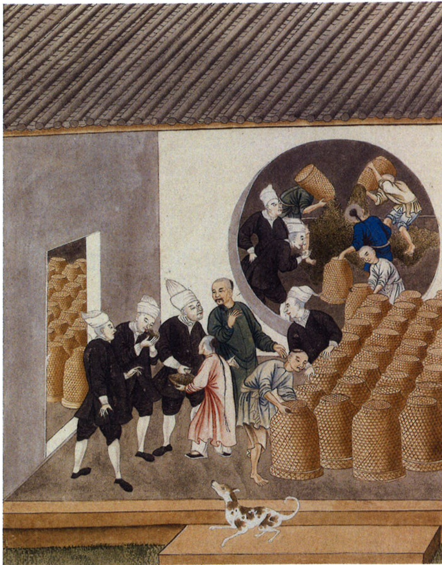
Afb. 3 Het keuren van thee door de handelaren van de VOC, anoniem, papier, dekverf, 31,3 x 25 cm., China, ca. 1770, Rijksmuseum Amsterdam, inv.nr. NG-1981-12-B

Al met al is Zijden Draad een interessant en lezenswaardig boek, vol waardevolle informatie over het gedeelde verleden tussen Nederland en China, waarbij wederzijdse kansen en belangen op velerlei gebied, een rode draad zijn en blijven in deze boeiende betrekkingen.