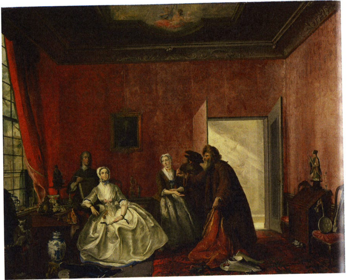
Afb. 2 De spilpenning (scène uit het toneelstuk De spilpenning of de verkwistende vrouw van Thomas Asselijn), Cornelis Troost, olieverf op paneel, 68,5 x 86 cm., 1741, Rijksmuseum Amsterdam, inv.nr. SK-A-4209

onduidelijk waarom dit soms niet gebeurt. Zonder een visuele analyse, maar vooral zonder verwijzing, staan de illustraties, hoe boeiend op zichzelf ook, soms jammerlijk los van de tekst en moet de lezer zelf de link leggen met de tekst.