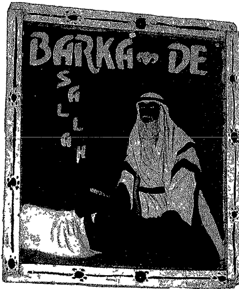
Baraka de Sallah ('Beste Wensen voor het feest'), Yoruba, Nigeria. Dit oheverf-paneel toont Abraham wiens geloof in God op de proef wordt gesteld. Londen, Horniman Museum. Foto: John Picton, 1991.

Als Afghanistan en de Chinese provincie Xinjiang niet worden meegerekend, omvat de landmassa van Centraal-Azië bijna vier miljoen