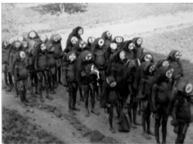
Initiatierite, Sierra Leone 1935 foto Sjoerd Hofstra / African Studies Centre Leiden