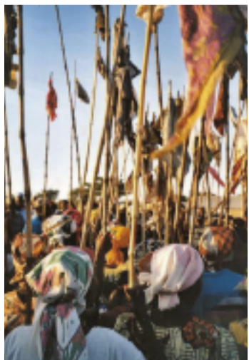
Festival Kameroen 2014

In Nederland waren organisaties als de Stichting Academisch Erfgoed, de Koninklijke Bibliotheek, het Nationaal Archief, het Tropenmuseum, Nederlands Instituut voor Beeld en Geluid, de Rijksdienst voor het Cultureel Erfgoed, het Rijksmuseum, universiteiten van Maastricht en Utrecht en instellingen als het NIOD, Vredespaleis, EYE, KITLV en het Afrika-Studiecentrum betrokken. Soms participeerden ze als zelfstandige instellingen, soms in groepsverband met wel 12 instellingen, zoals de Werkgroep Speciale Wetenschappelijke Bibliotheken. In totaal doneerden Nederlandse instellingen al ruim 700.000 afbeeldingen aan Wikimedia Commons en verbeterden ze de kwaliteit van de artikelen in de online encyclopedie.