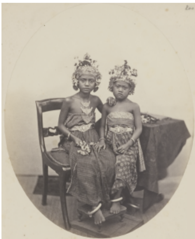
Dochters van de radja van Boeleleng