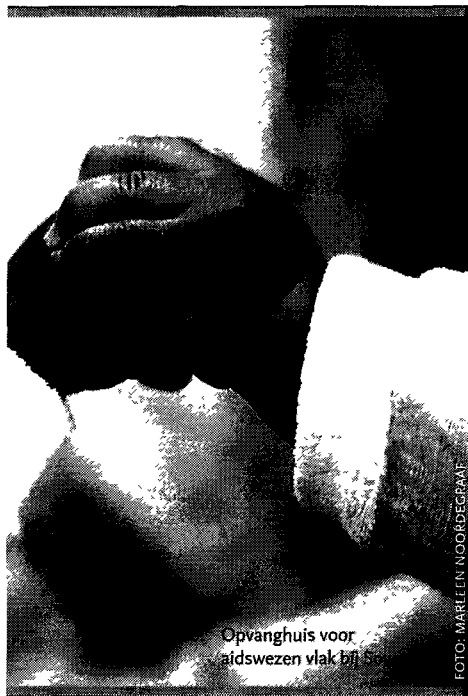
Opvanghuis voor aidswezen vlak bij

Welk ideologisch model ze ook omarmden – socialisme of kapitalisme – uiteindelijk vertoonden de politieke machtsstructuren in de meeste staten een opvallende overeenkomst. Achter de officiële façade van de moderne staat – regering, parlement, ambtelijk apparaat, rechterlijke macht, nationale bank – gaat een piramide van patronagerelaties schuil. Het nationale belang en de natiestaat blijven abstracte begrippen. Politici bouwen hun machtsbasis op een persoonlijk relatiernetwerk, dat wordt onderhouden met diensten en wederdiensten. De postkolo-