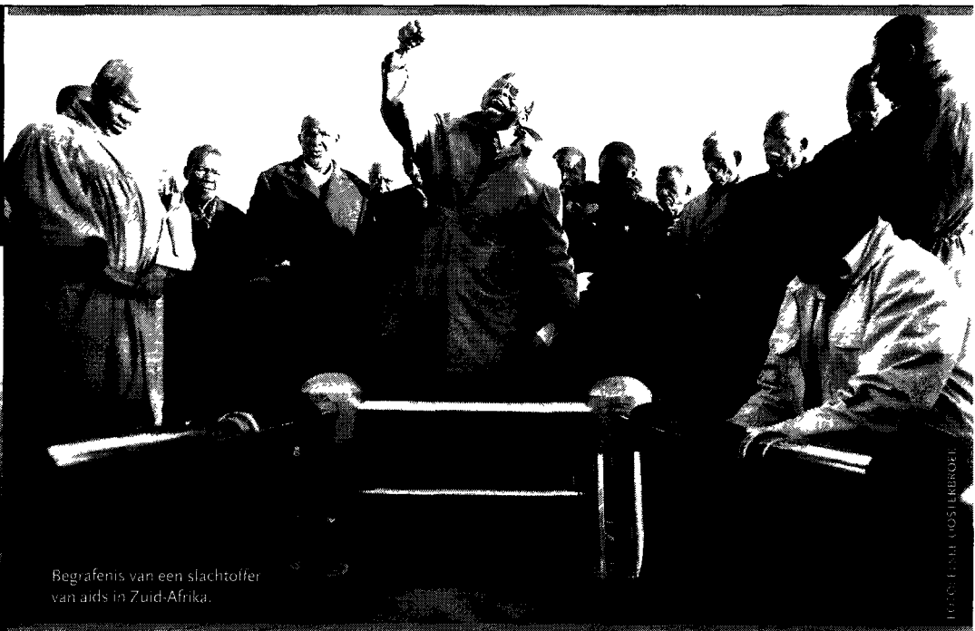
Begravenis van een slachtoffer van aids in Zuid-Afrika.