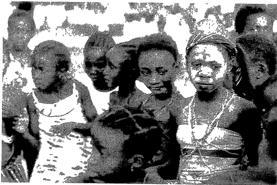
• Carnaval in Guinee-Bissau

Een van de eerste 'parks beyond parks' was Kimani Community Wildlife Sanctuary, gelegen ten noorden van Amboseli. Rondom een moeras, waar veel wild zich ophoudt, werd 40 acres voor het wild gereserveerd. In februari 1996 startte het pro-