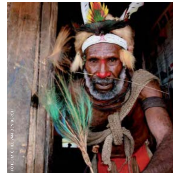
Lid van de Tikibi-clan met veren van de Blauwe Paradijsvogel.

Meer informatie: www.rug.nl/frw/onderwijs/scriptieprijs/index