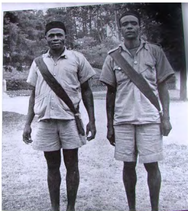
Photo 6.1 Two messengers in their official outfits