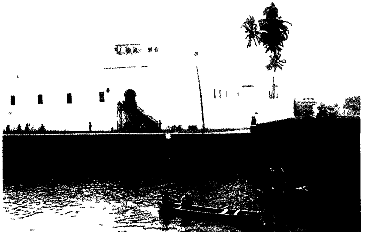
Kasteel St George. Hiervandaan vertrokken de soldaten naar Java.

inheemse vrouwen woonden ze bij Poerworedjo in een 'Afrikaanse kamp' op Midden-Java, waar ze al spoedig bekend stonden als 'Belanda Hitam'. Militaire dienst bij het KNIL werd een familietraditie, die overging van vader op zoon, tot aan de soevereiniteitsoverdracht aan Indonesië. De meeste afstammelingen kozen toen voor repatriëring naar