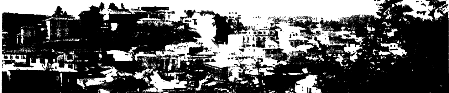
Java Hill, Elmina.