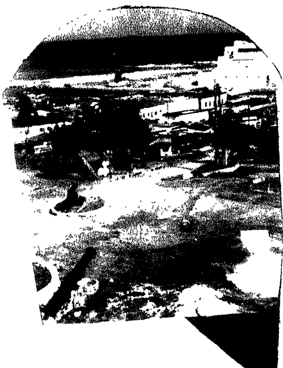
Zicht op kasteel St. George, vanaf fort St. Jago in Elmina.